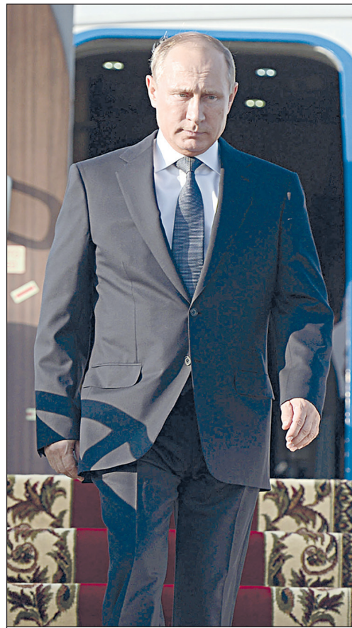
Алексей Никольских / ТАСС