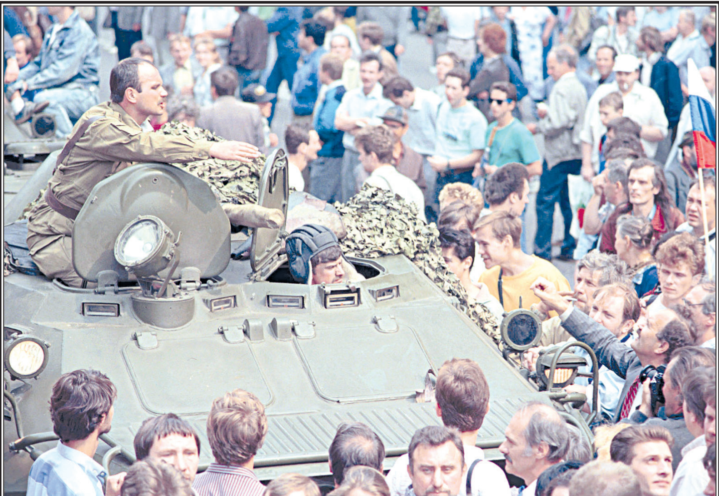
Москва. Манежная площадь, 19 августа 1991 г.