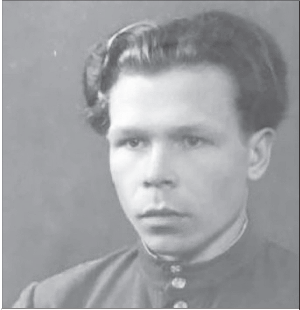
Из архива автора