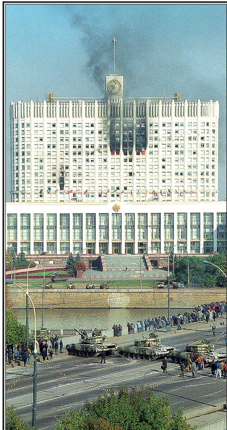
Из Белого дома депутатов цепочкой выводили по танковому коридору.