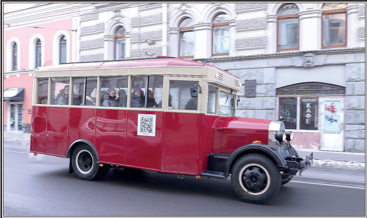
Отреставрированный ЗИС-8 на Гороховой улице в Санкт-Петербурге.