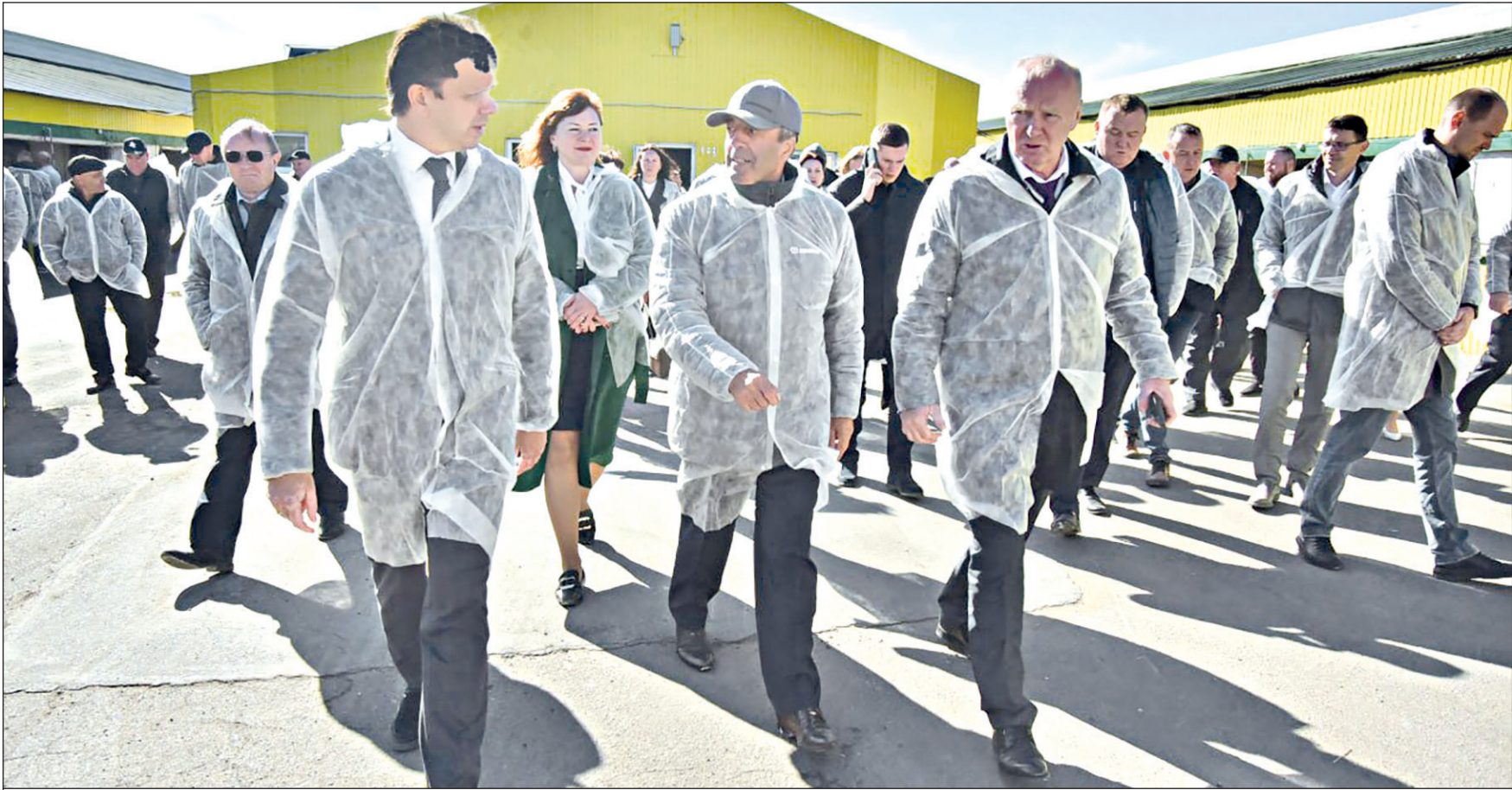
Так уверенно А. Клычков исходил, пожалуй, всю Орловщину. Поучал, советовал, добивался.

Губернатор Андрей Клычков отвечает на вопросы «Советской России»