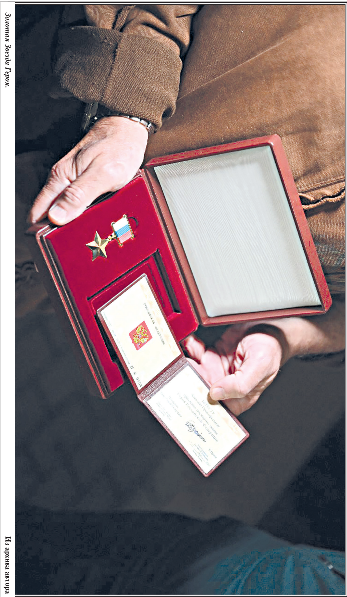
Золотая Звезда Героя.