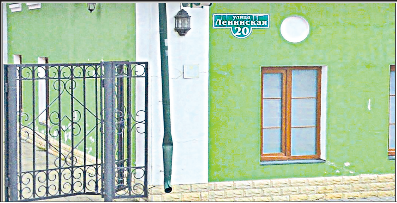
Город Ростов Великий, улица Ленинская.