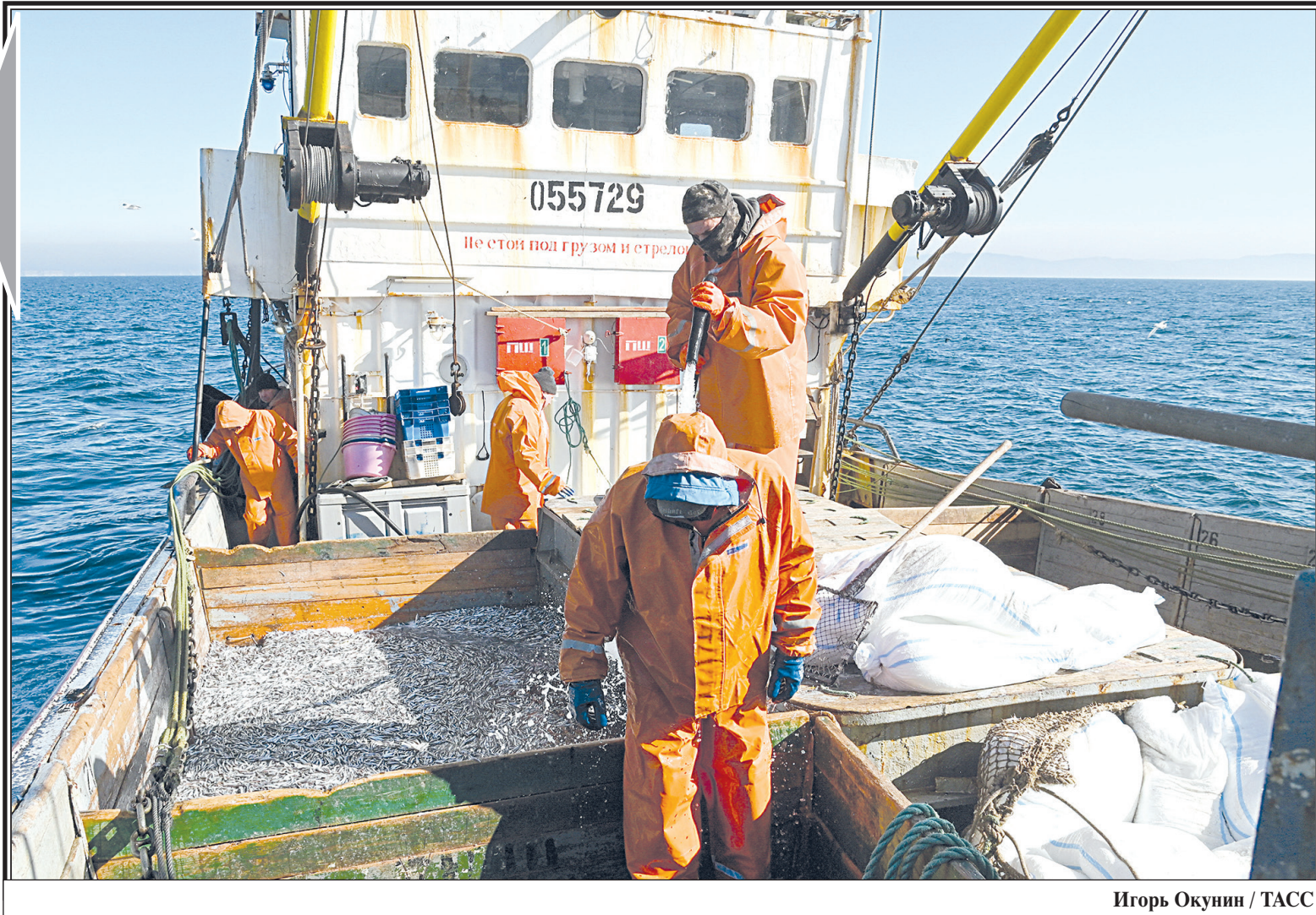
Игорь Окунин / ТАСС