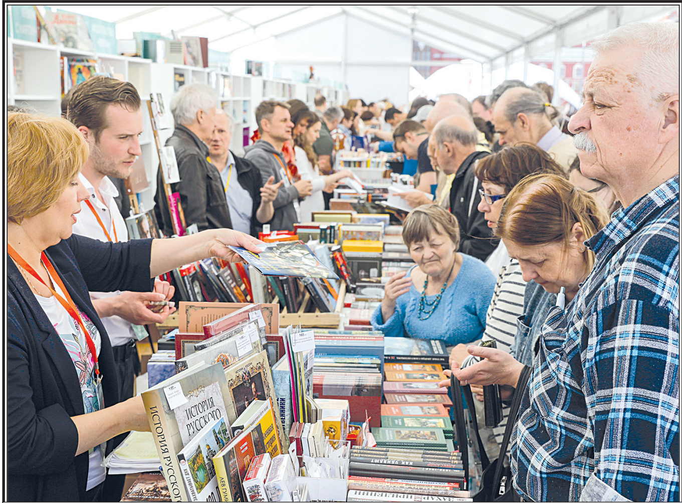
Книжная ярмарка на Красной площади