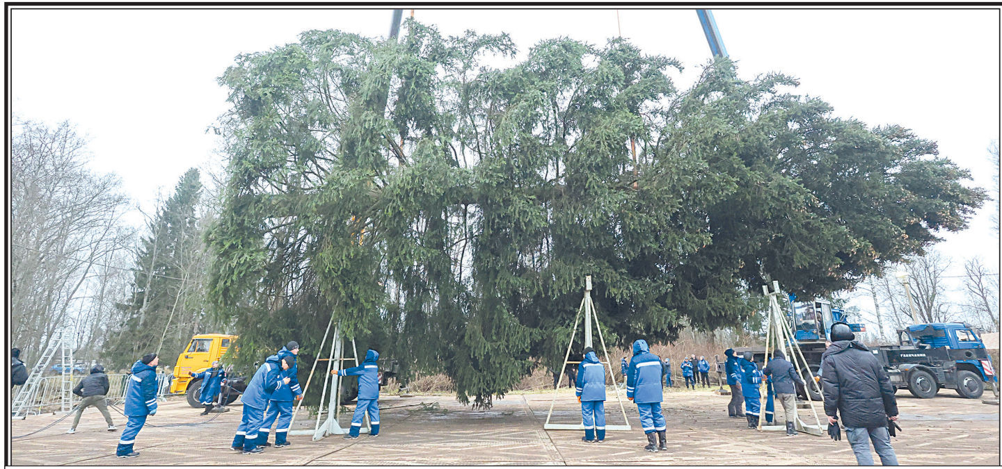
Главная новогодняя елка страны высотой 26 метров украсит Соборную площадь Московского Кремля.

Отметим, что с 2007 года главную новогоднюю ель в Кремль выбирают только из Московской области.