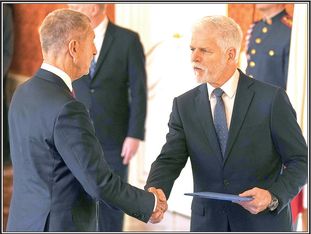
Президент Чехии Петр Павел и лидер партии АНО Андрей Бабиш (справа налево) на церемонии принятия присяги Бабиша в качестве премьер-министра.

Отвечая на вопрос о продолжении помощи Украине, Бабиш подчеркнул ее гуманитарный характер. Он не прокомментировал предложение передать киевскому режиму замороженные в Евросоюзе российские активы.