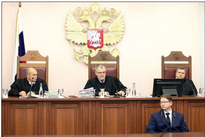
Рассмотрение в Верховном суде дела Ларисы Долиной