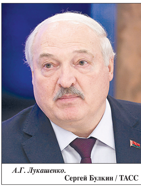
А.Г. Лукашенко.

Александр Лукашенко отметил, что, если бы Дональд Трамп в то время возглавлял