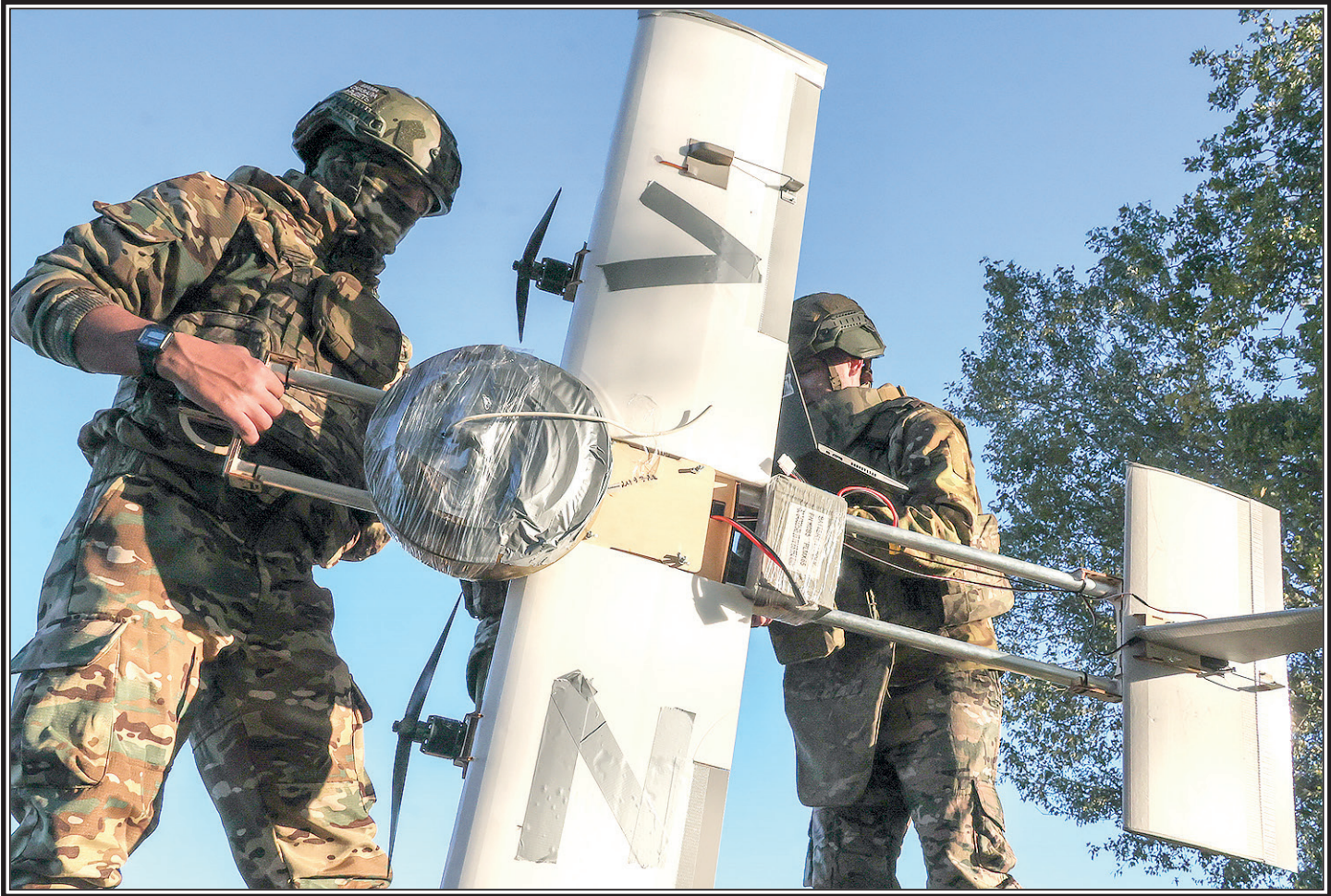
Российские войска начали получать беспилотники с элементами ИИ

«Ну и не американцам считать голоса в Венесуэле. Помните, когда Трампа, как у нас говорят, бросили, опрокинули на выборах прошлый? Там бюллетени у вас под забором находили, у вас по почте голосовали, – напомнил глава государства. – Стопроцентно были фальсифицированы ваши выборы, когда победил Байден и вы Трампа выбросили на обочину. Что, этого не было? И американцы сегодня с таким багажом предвыборным не признали выборы в Венесуэле, в Беларуси им еще глше-то. Да Господь с вами! Ну не признали и не признали».