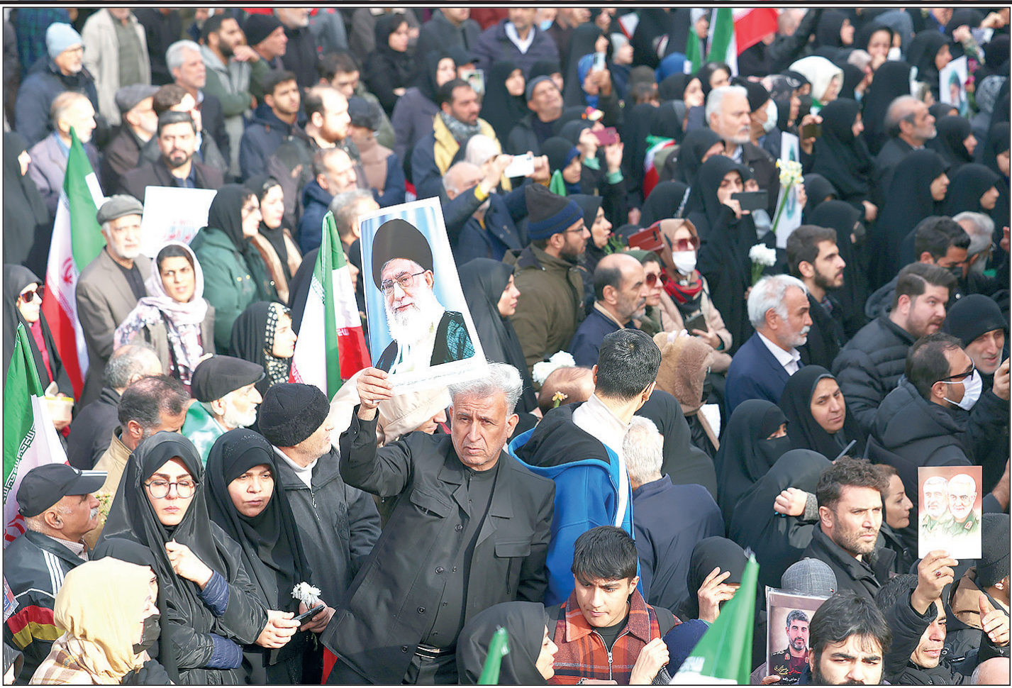
В Иране проходят митинги в поддержку действующего руководства страны.

А тем временем здравомыслящая часть населения Ирана уходит на митинги с требованиями прекратить вмешательство США во внутренние дела своей страны.