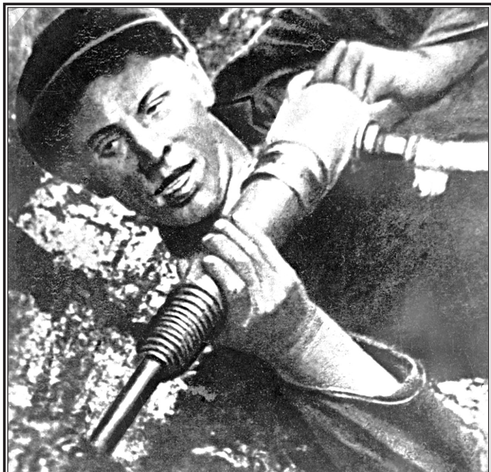
Алексей Григорьевич Стаханов.