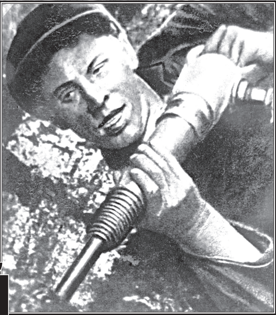
Алексей Григорьевич Стаханов

Событие это стало колоссальнейшим, и утром 31-го, буквально через час после рекорда, собрался партком шахты и принял постановление: занести имя Стаханова первым на Доску Почета лучших людей шахты. Выдать премию в размере месячного оклада. К 3 сентября предоставить квартиру и установить в ней