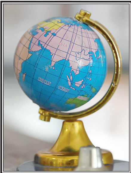
Головокружение глобуса

Справедливости ради следует признать, что Дональд Трамп большие никакие зарубежные территории не называл возможными будущими «штатами» в составе США. Он лишь требовал установления контроля над зарубежными территориями. Это Гренландия, Панама, Венесуэла, Колумбия, Куба, сектор Газа, Украина, Иран. В своих выражениях по поводу способов установления контроля Трамп не стеснялся. Так, в отношении Панамы он сказал: «Это передача управления каналом в руки Панамы. – В.К.) было сделано не для пользы других, а просто в знак сотрудничества между нами и Панамой. Если принципы, как моральные, так и юридические, этого великодушного жеста дарения не будут соблюдены, то мы потребуем, чтобы Панамский канал был возвращен нам полностью и без вопросов».