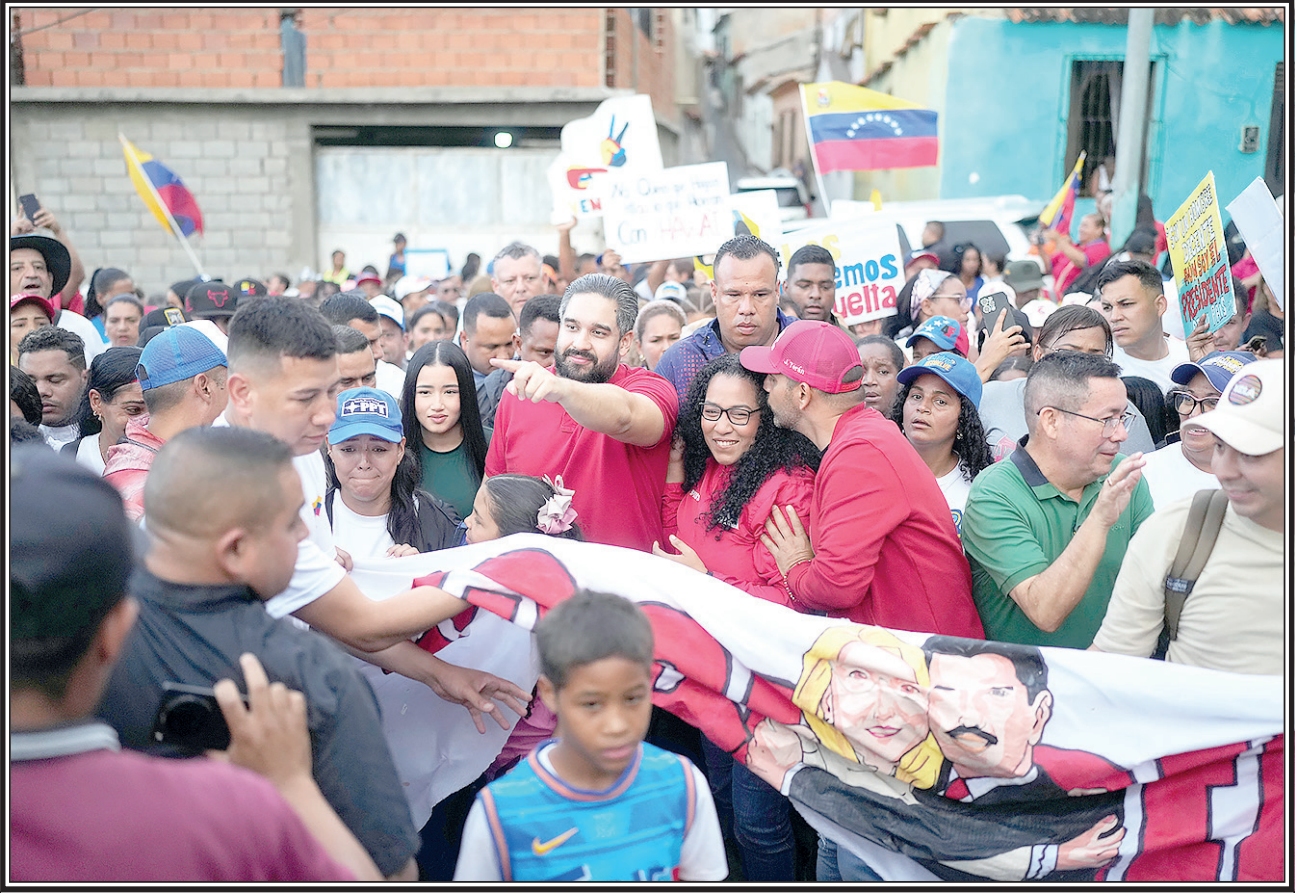
Акция с требованием освободить Н. Мадуро и его супругу.