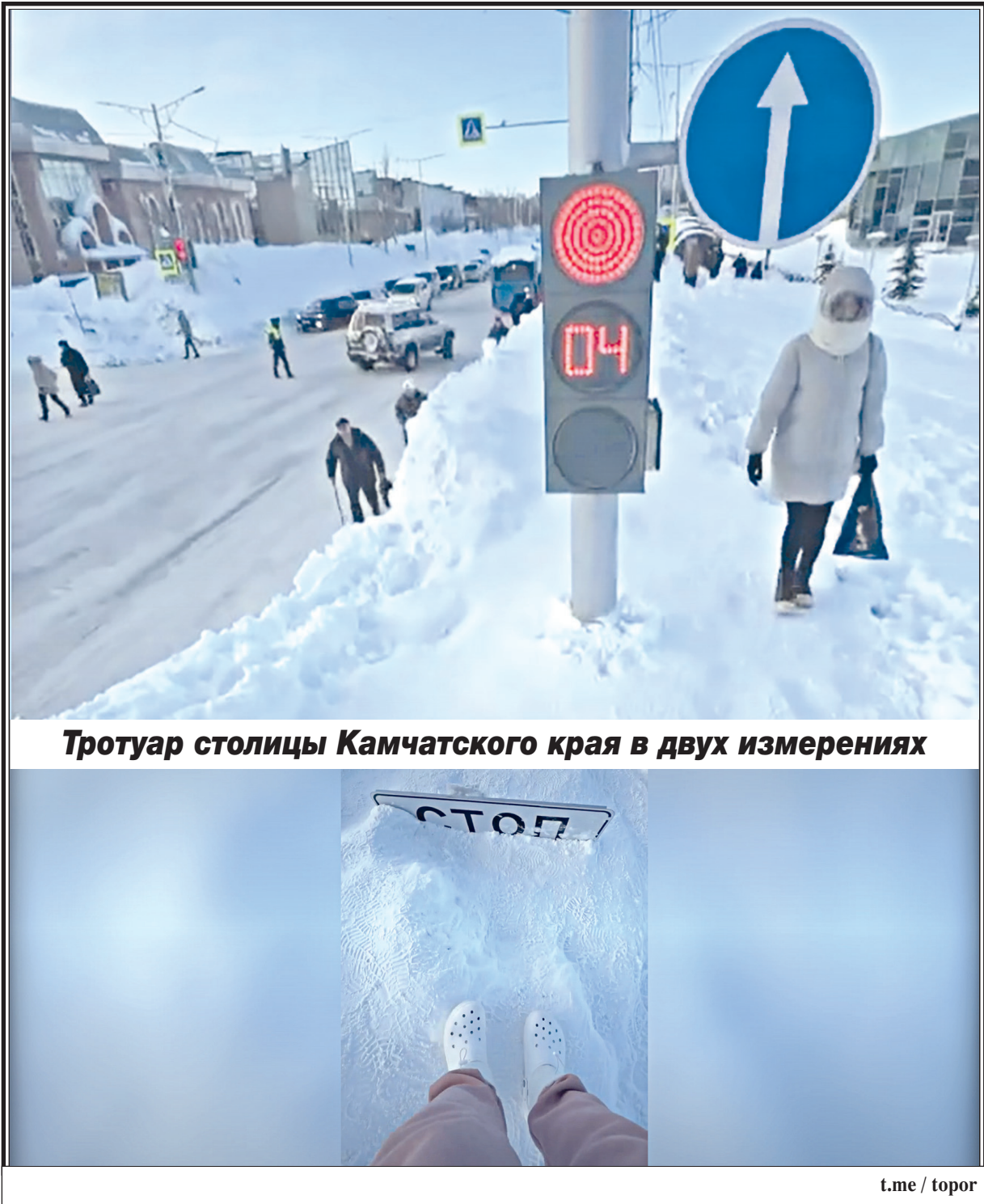
Тротуар столицы Камчатского края в двух измерениях