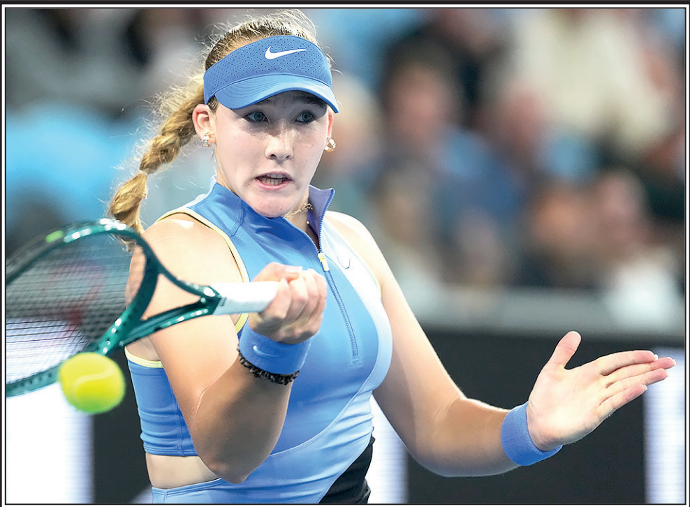
Мирра Андреева на турнире Australian Open

Открытый чемпионат Австралии является первым в сезоне турниром Большого шлема и проводится на покрытии «хард». Соревнования завершатся 1 февраля. Призовой фонд турнира – около 75 млн долларов.