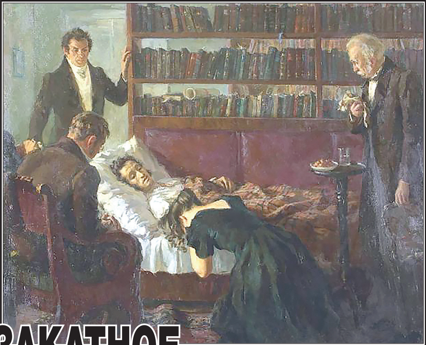
«28 января 1837 г. Последние минуты А.С. Пушкина». худ. И.И. Танклевский, 1949 г.