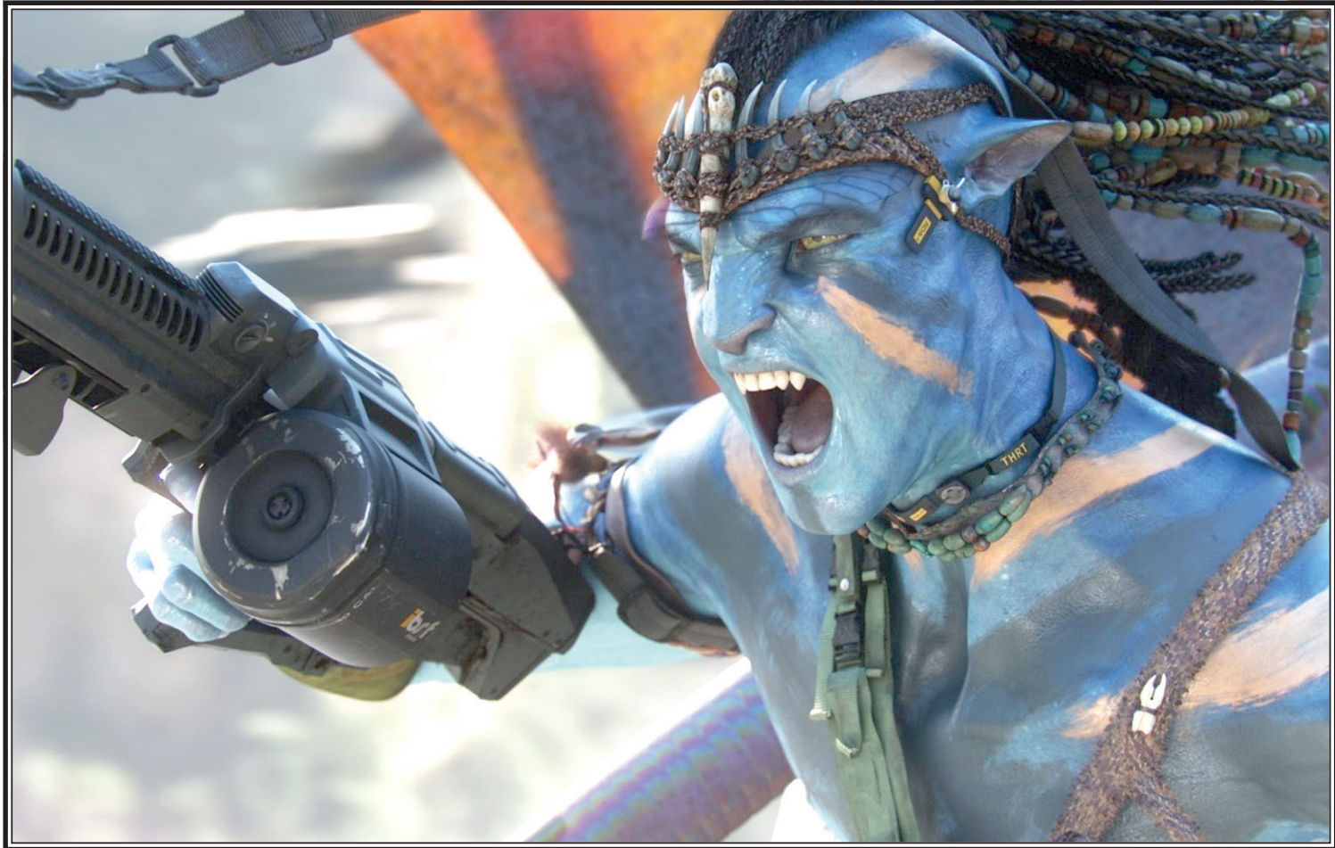
Кадр из к/ф «Аватар»