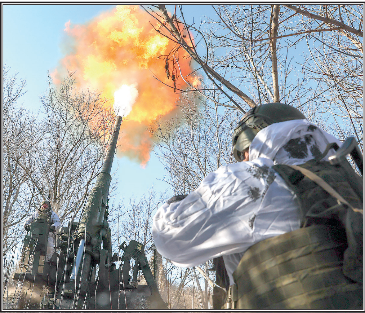
Россия, Луганская Народная Республика

Боевая работа расчета самоходной пушки 2С7 «Пион» 2-й гвардейской артиллерийской ордена Суворова бригады имени маршала артиллерии Николая Воронова в зоне проведения специальной военной операции.