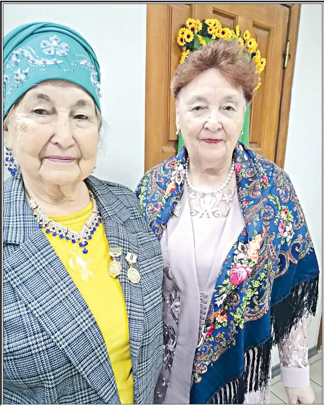
Пресс-служба Тюменского обкома КПРФ