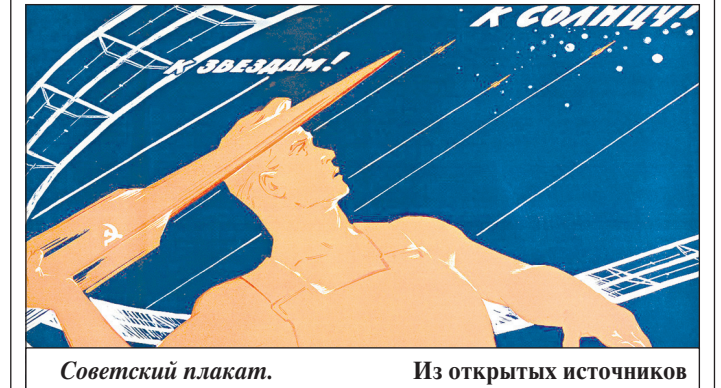
Советский плакат.

жизни хотели бы побывать в космосе. При этом самый высокий интерес к космическим полетам зафиксирован у аудитории в возрасте от 25 до 34 лет (78%), — говорится в исследовании, приуроченном ко Дню космонавтики. В опросе приняли участие более 3 тыс. человек.