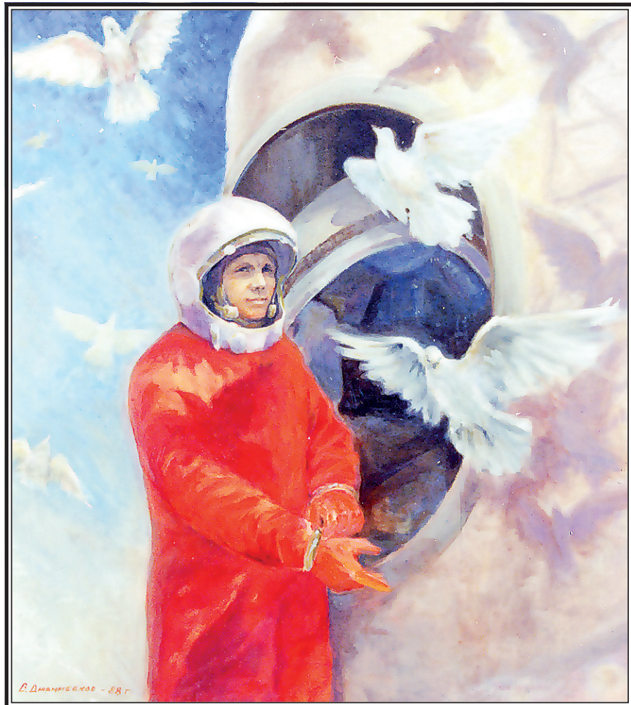
Картина летчика-космонавта Владимира Джанибекова «Гагарин перед стартом».

классического философского построения, но близок именно к рассудочному характеру его прозы: фантастической в той же мере, в какой и философской.