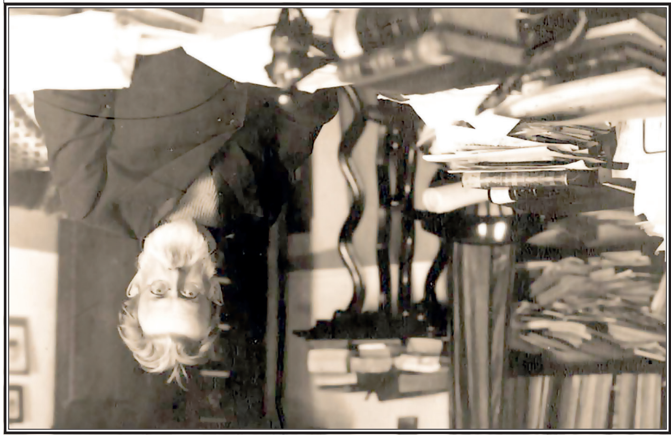
В.И. Вернадский в своем рабочем кабинете. Ленинград, 1921 год.