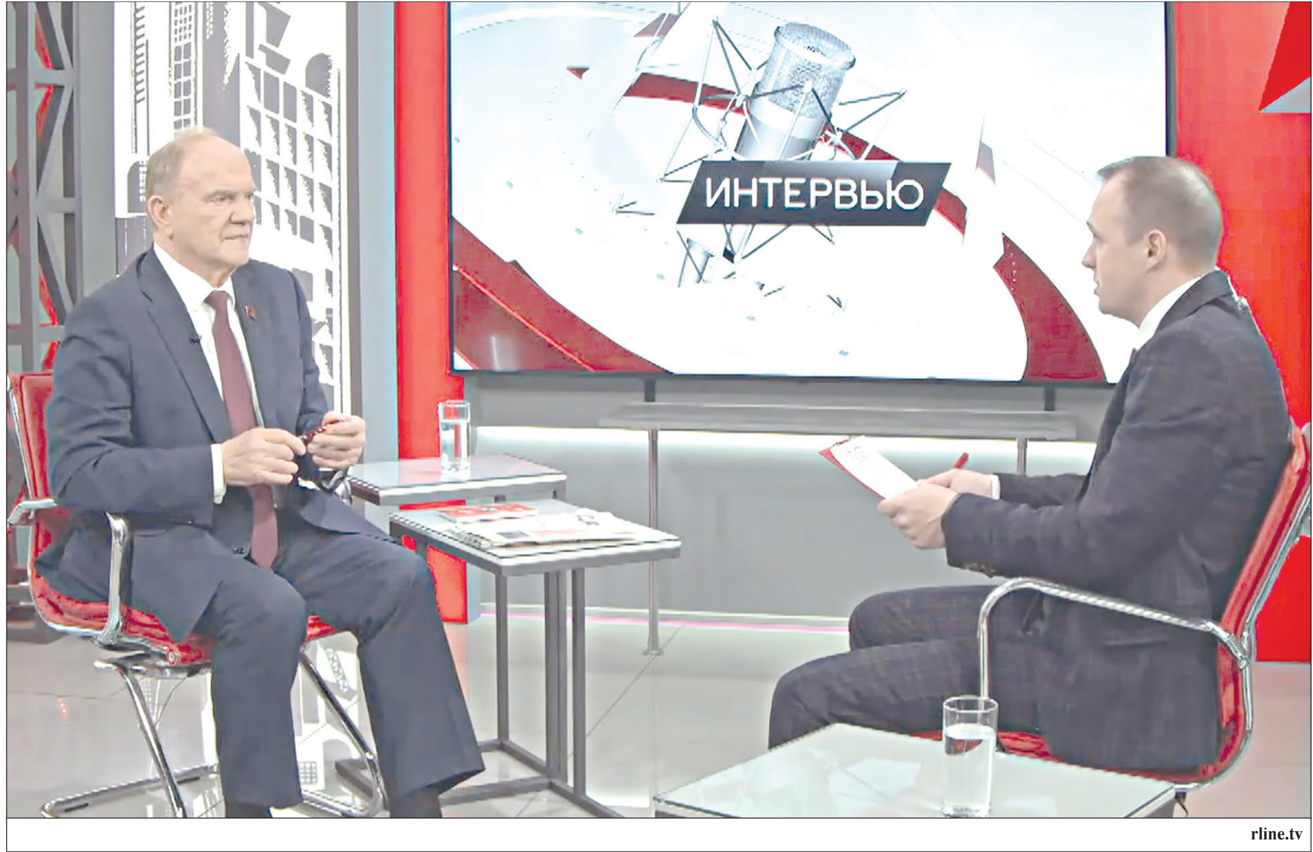
Г.А. ЗЮГАНОВ, Председатель ЦК КПРФ, Руководитель фракции КПРФ в Госдуме: