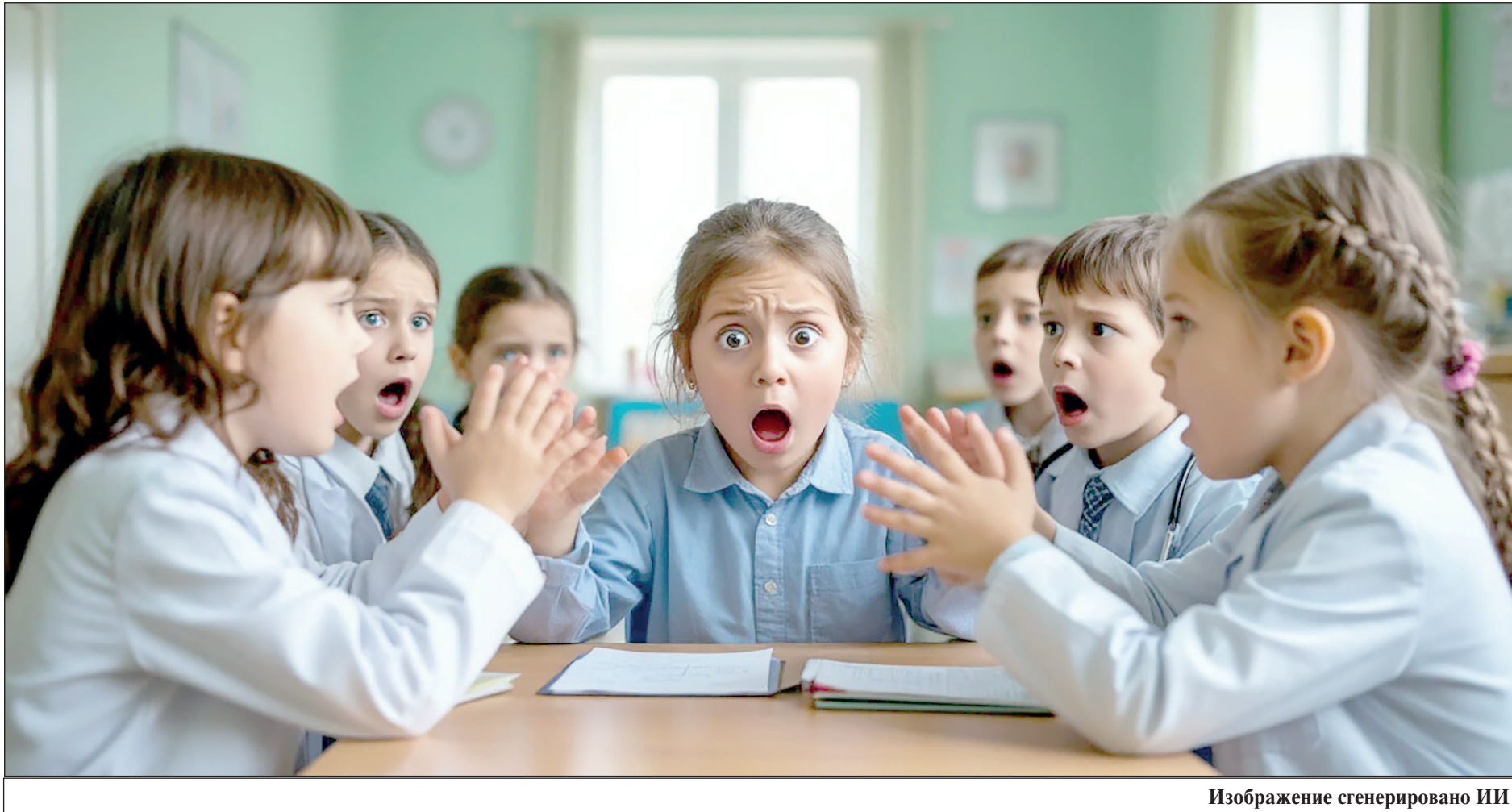
Изображение сгенерировано ИИ

Вот лишь несколько реальных историй, показывающих, к чему может