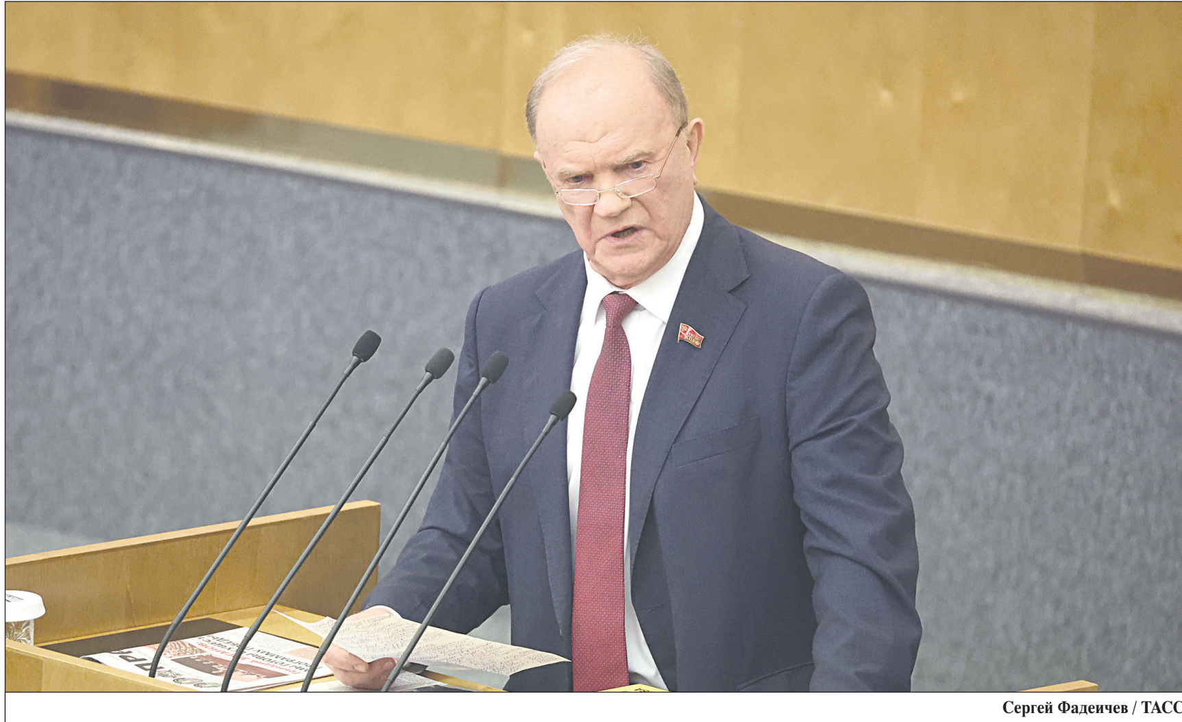
Сергей Фадеев / ТАСС

Нам придется принимать срочные и ответственные решения, чтобы переломить ситуацию. Только победы во всех этих трех войнах могут сложиться в ту глав-