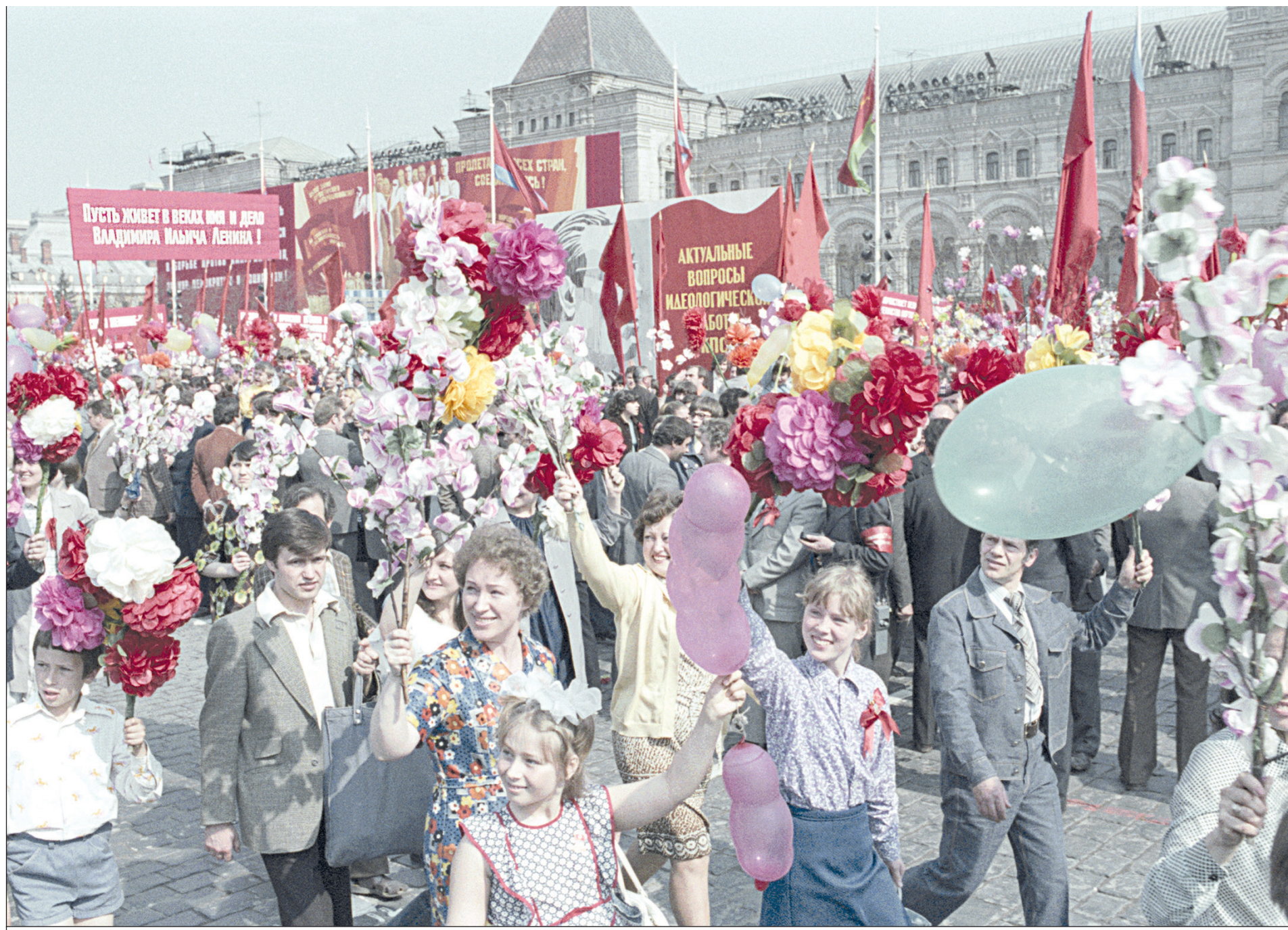
Валентин Мастоков / ТАСС