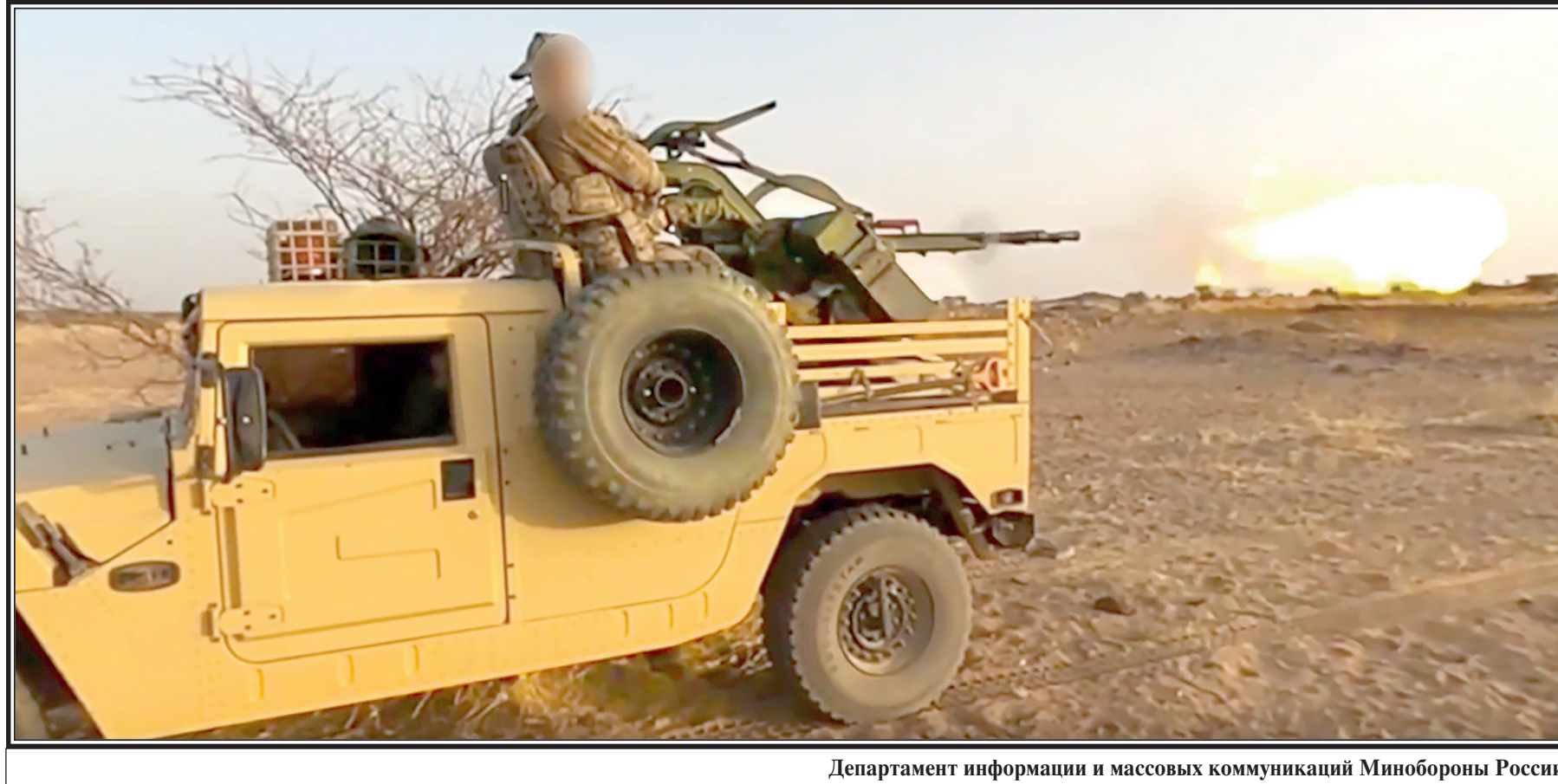
Департамент информации и массовых коммуникаций Минобороны России

В Ярославле историки во время археологической экспедиции нашли серебряную копилку Ивана Грозного, которая относится к XVI веку. Об этом сообщает пресс-служба Ярославско-