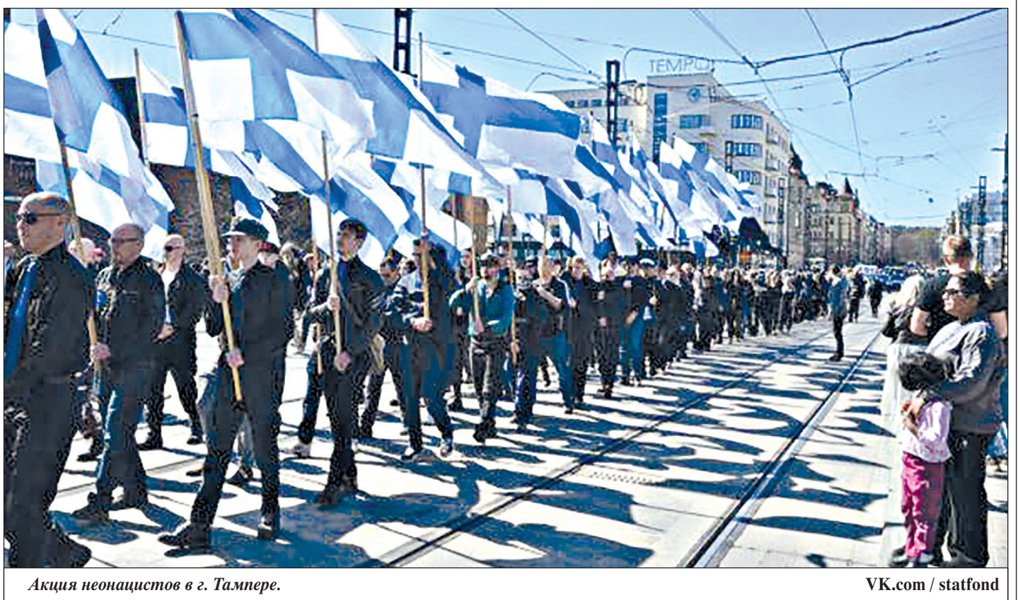
Акция неонацистов в г. Тампере.

* Ресурс заблокирован в РФ по требованию Роскомнадзора.