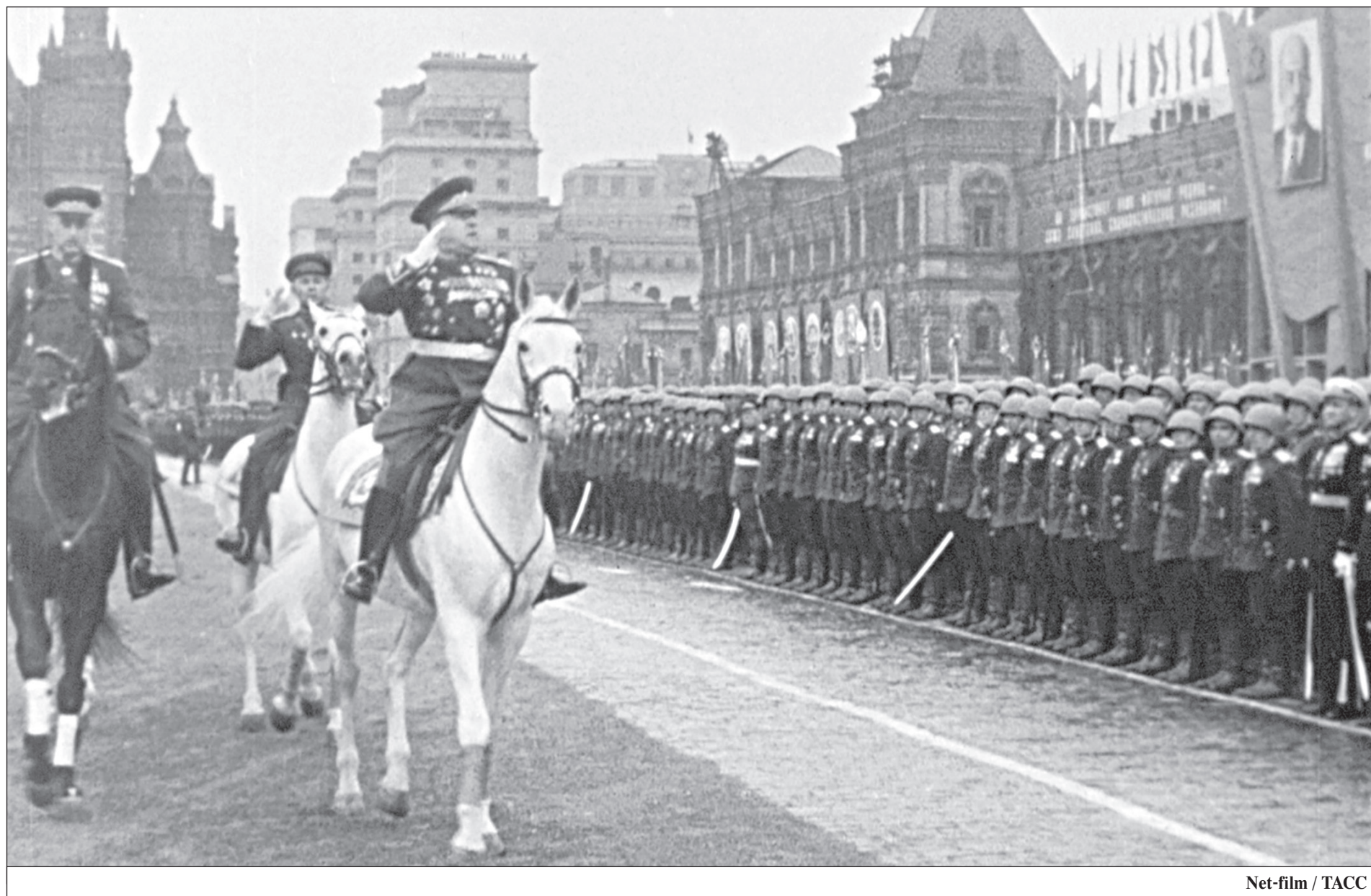
Net-film / TACC