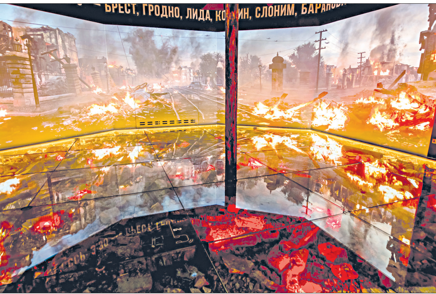
Музейный комплекс «Дорога памяти», 1418museum.ru