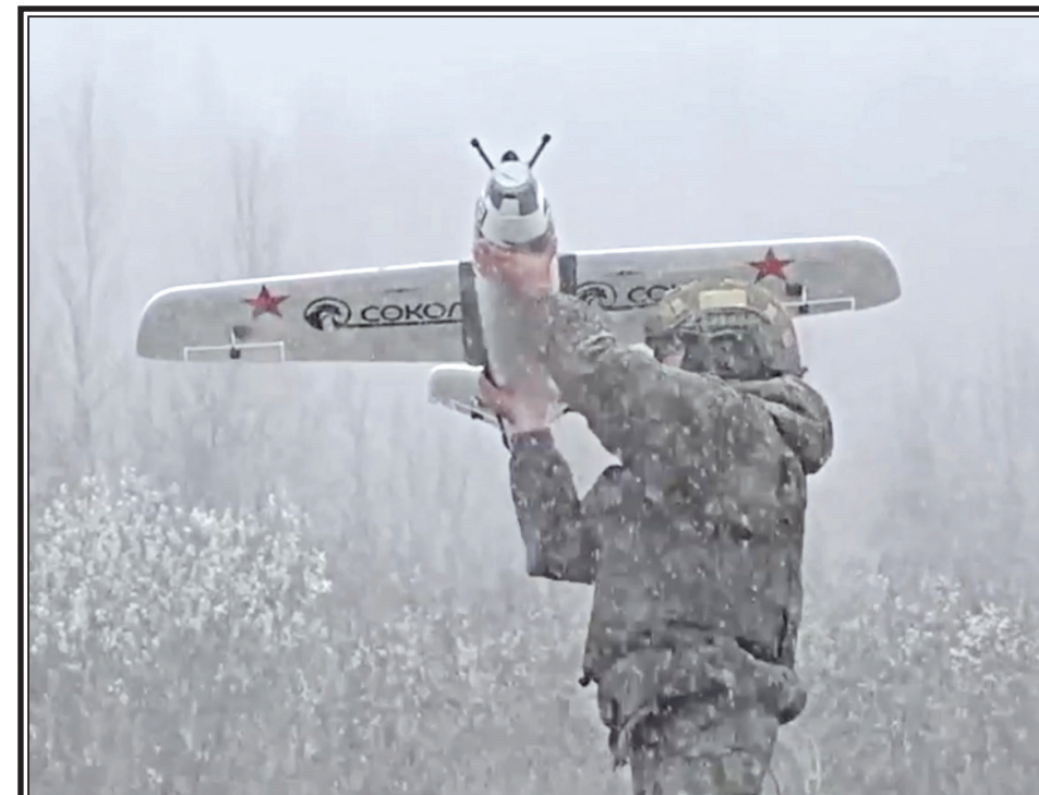
Отработка навыков управления БПЛА на полигоне.