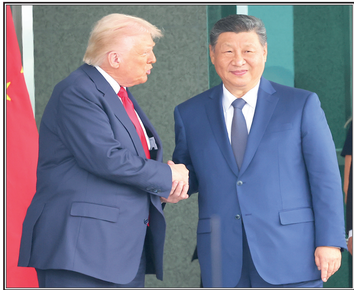
Дональд Трамп и Си Цзиньпин после переговоров в Пусане.

Никак не высказывался президент США по поводу т.н. прав человека в Китае. Западные эксперты отмечают, что Трамп стал первым американским