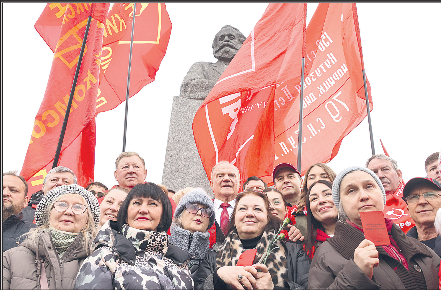
8 мая 2026 г. в центре Москвы.