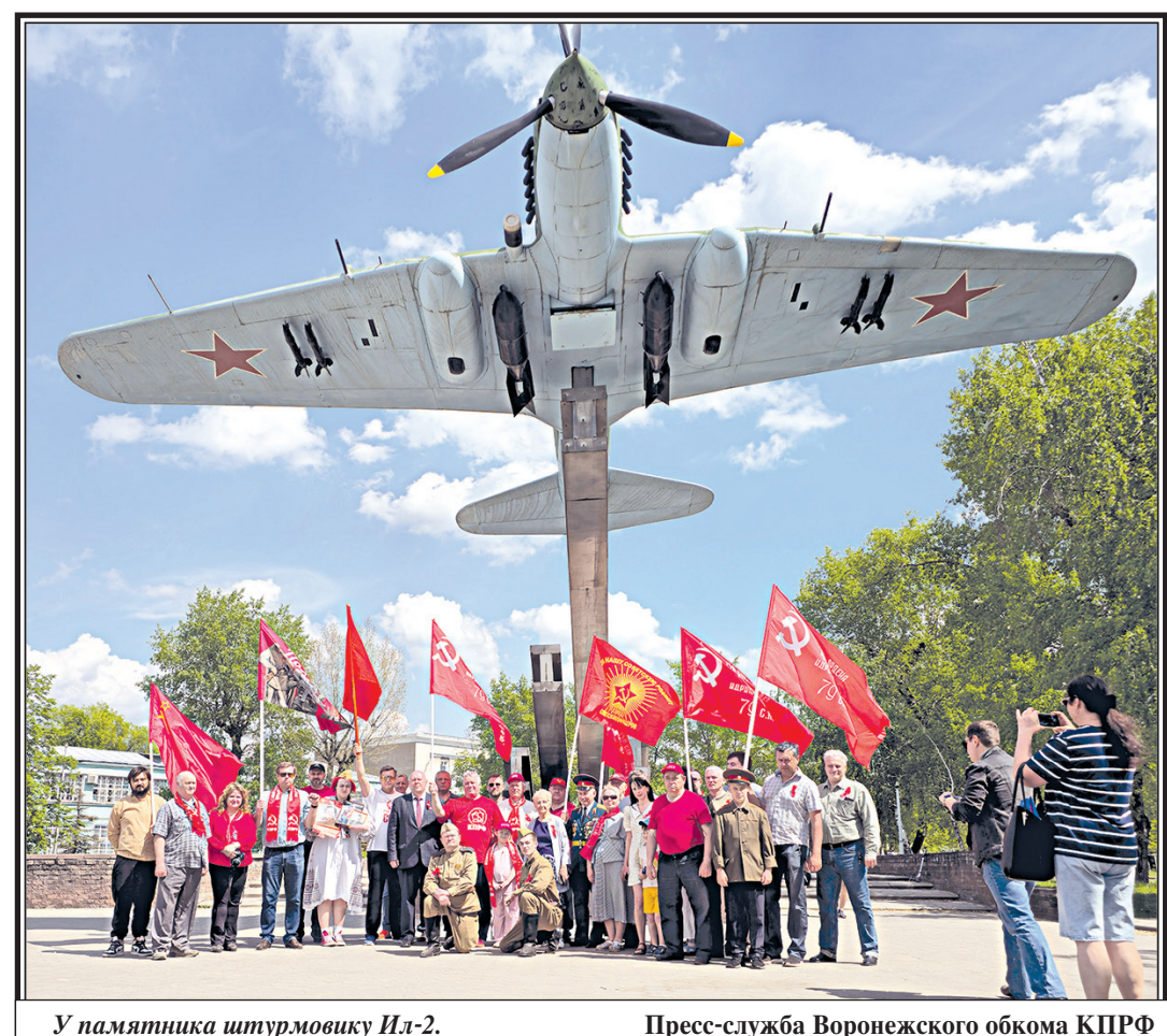
У памятника штурмовику Ил-2.