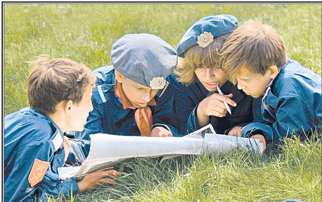
Пионерская игра «Зарница», Челябинск, 1972 г.

СОВЕТСКАЯ РОССИЯ АНО «Народная газета КПРО» Газета зарегистрирована федеральной службой по надзору в сфере связи, информационных технологий и массовых коммуникаций. Свидетельство о регистрации ПИ № ФС 77-89914 от 15.01.2025