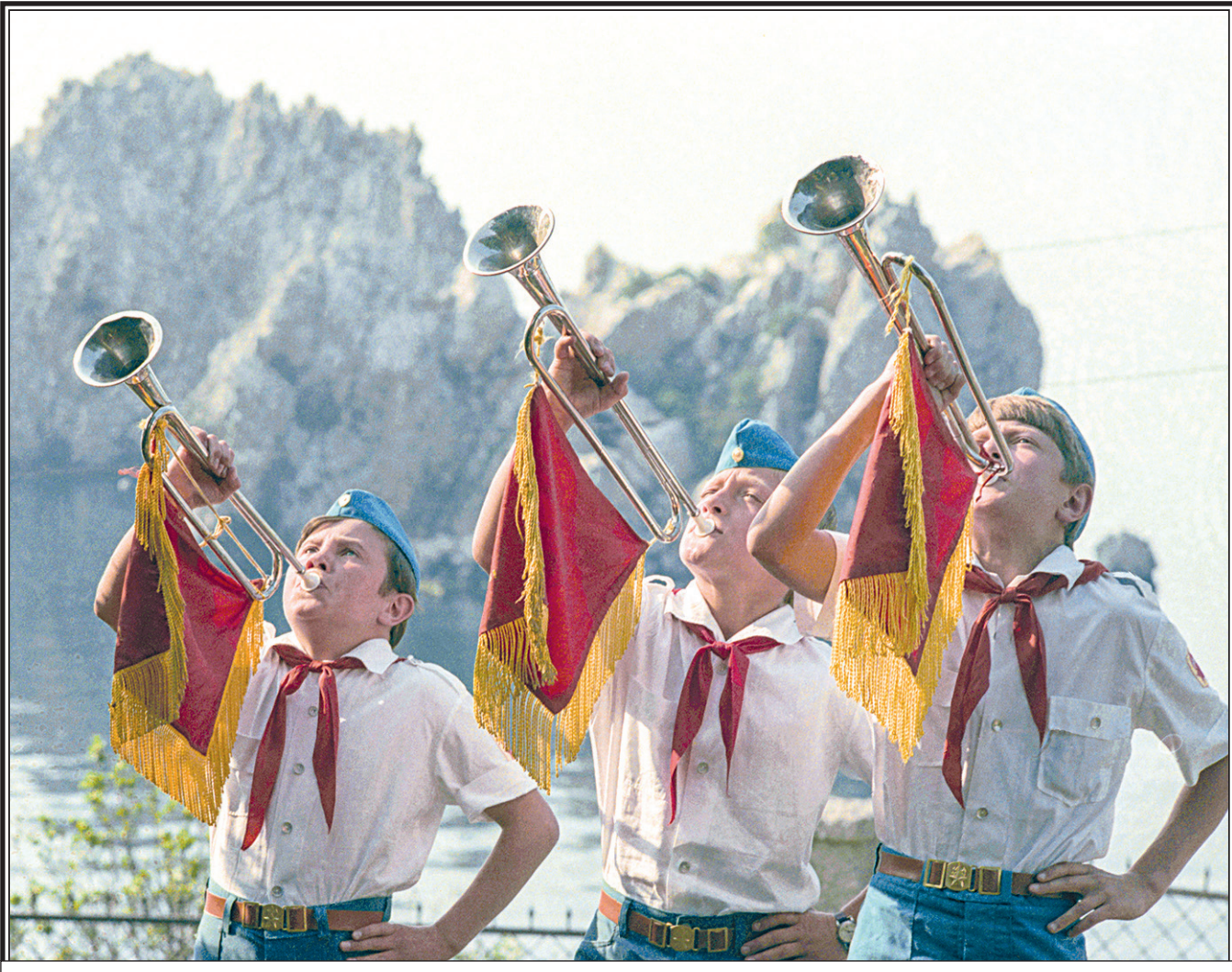
Пионерский лагерь «Артек», 1985 г.