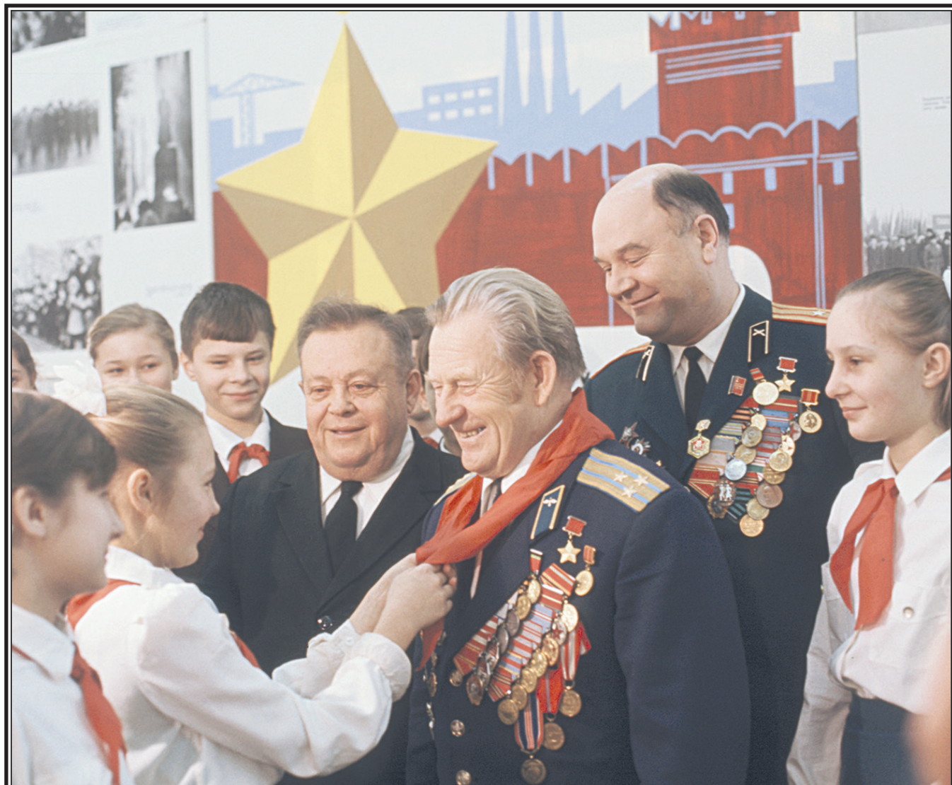
Встреча пионеров с ветеранами Великой Отечественной войны, Тула, 1977 г.

Пионерия вырастила поколения людей, которыми мы по праву гордимся: космонавтов, ученых, инженеров, врачей, писателей, спортсменов – тех, кто строил страну, покорял космос, спасал жизни, создавал произведения искусства. Это были не просто талантливые личности – это были люди с закаленным характером, воспитанные на идеалах взаимопомощи, дисциплины и ответственности.