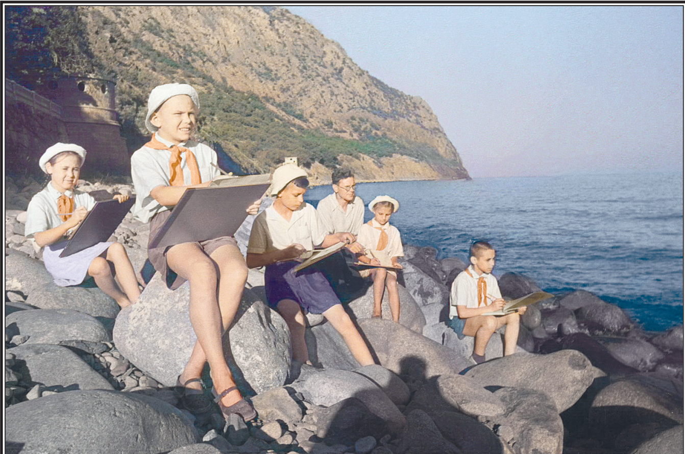
Детский художественный кружок на берегу Черного моря, Крым, лето 1950 г.