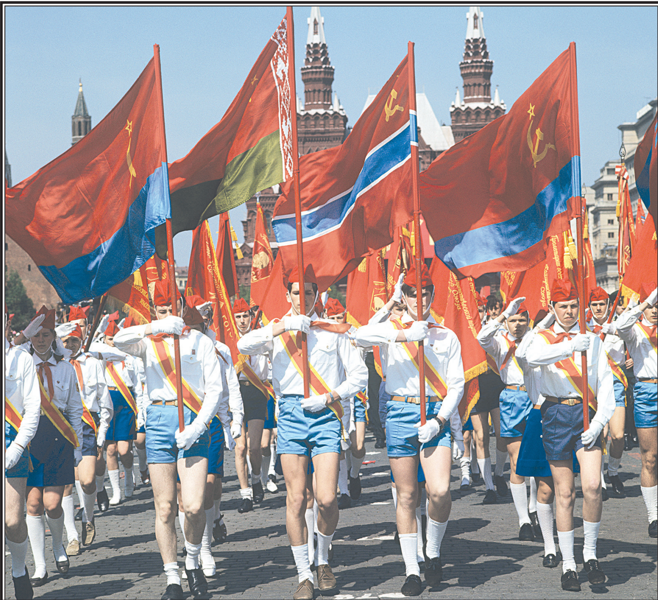
Марш-парад, посвященный 50-летию Всесоюзной пионерской организации им. В.И. Ленина.

(Окончание. Начало на 1-й стр.) Они толкают ее, выкрикивают оскорбления, унижают – а кто-то, стоя в стороне, снимает все на телефон. И не просто снимает – с улыбкой, с азартом, с гордостью за «подвиг». Потом ролик летит в Сеть: лайки, комментарии, мнимое признание среди сверстников. Как будто это не преступление против человеческого достоинства, а очередной челлендж, модный тренд.