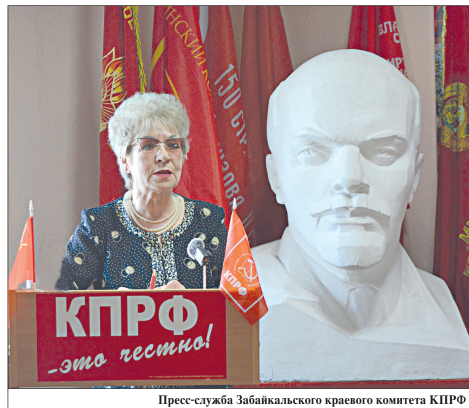
Пресс-служба Забайкальского краевого комитета КПРФ

От выживания – к развитию и справедливости