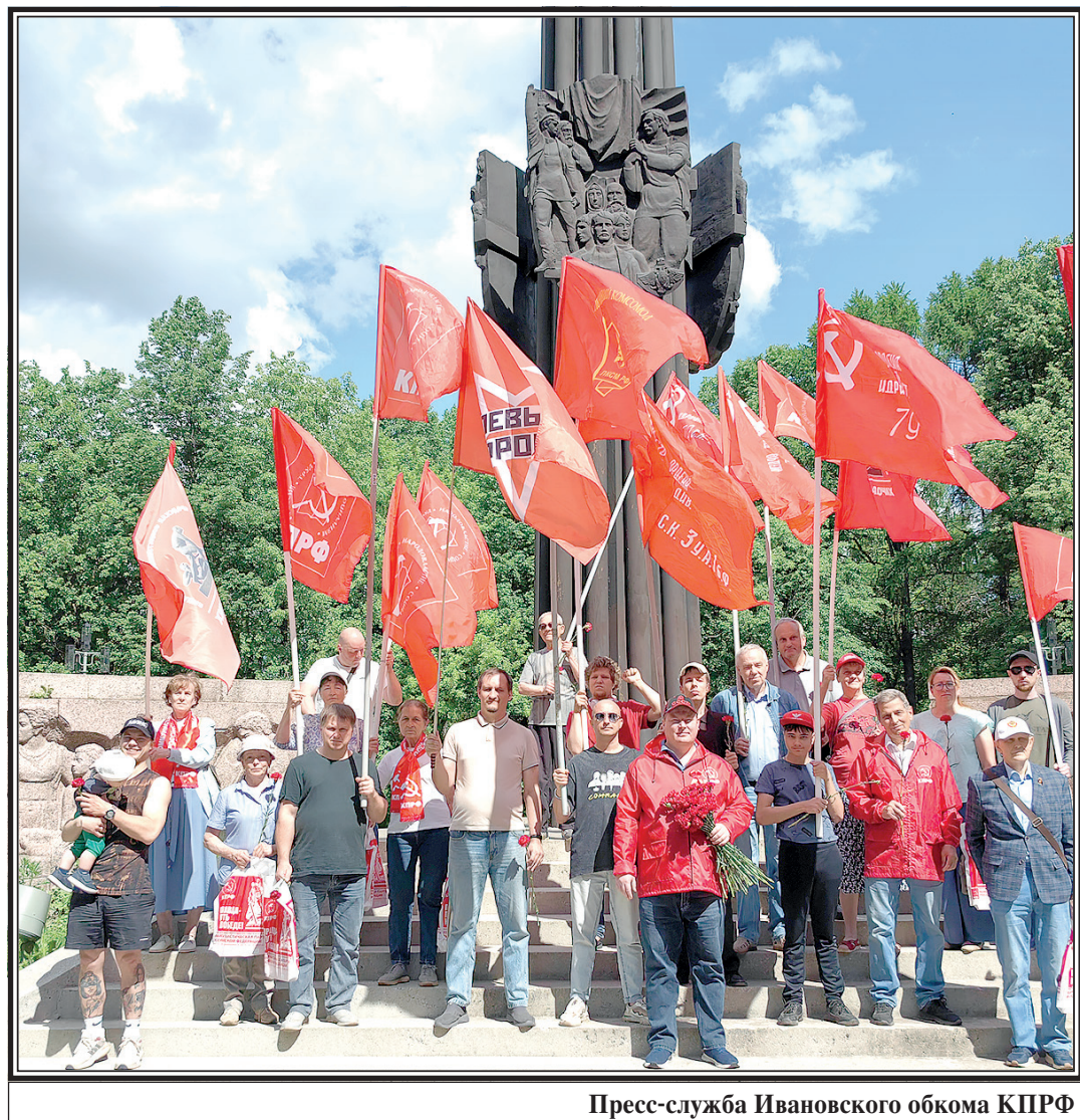
Пресс-служба Ивановского обкома КПРФ

Россия обязательно победит и сегодня. Но без нас вы победить не сможете. И я требую полноценного диалога и ответственной работы над нашей общей программой!