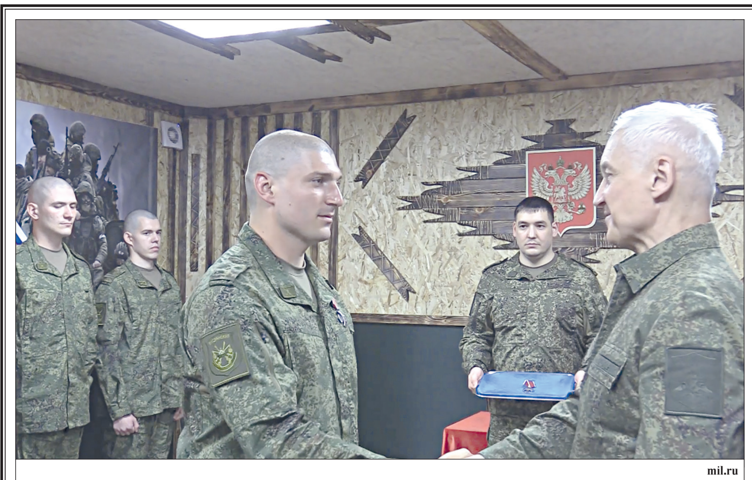
Министр обороны Российской Федерации Андрей Белоусов провел совещание на командном пункте группировки войск «Запад», где заслушал доклады командования о текущей обстановке в