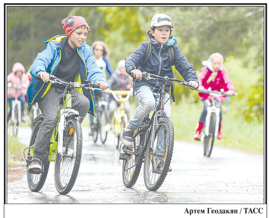
Артем Геоадякин / ТАСС