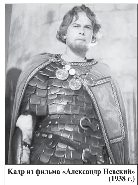
Кадр из фильма «Александр Невский» (1938 г.)

К сожалению, даже спустя четыре года войны многие так и не поня-