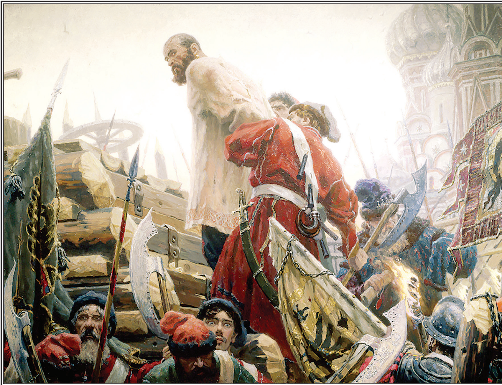
«Степан Разин», худ. Кириллов С.А., 1985–1988