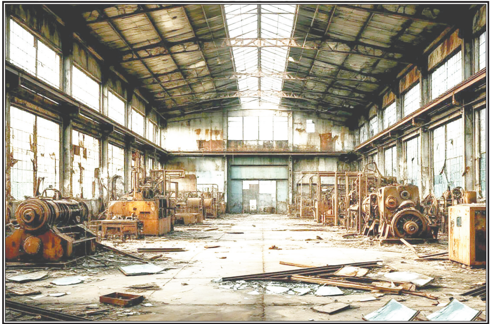
Изображение создано ИИ