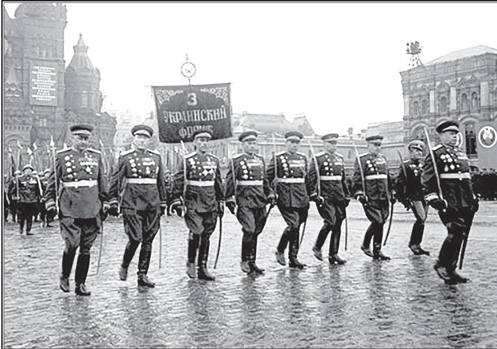
Воин-маршал на Параде Победы.

Приказом Президиума Верховного Совета СССР от 26 апреля 1945 года, опубликованным