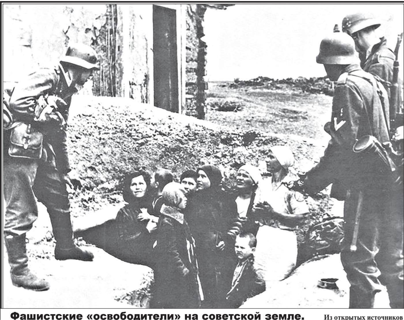
Фашистские «освободители» на советской земле.

Вероломное нападение фашистской Германии на Советский Союз привело к масштабным разрушениям наших городов и сел. На оккупированных территориях гитлеровцы организовали самый настоящий геноцид – в полном соответствии со своей звериной «расовой теорией». Кровавые расправы над мирным населением унесли жизни миллионов советских людей.