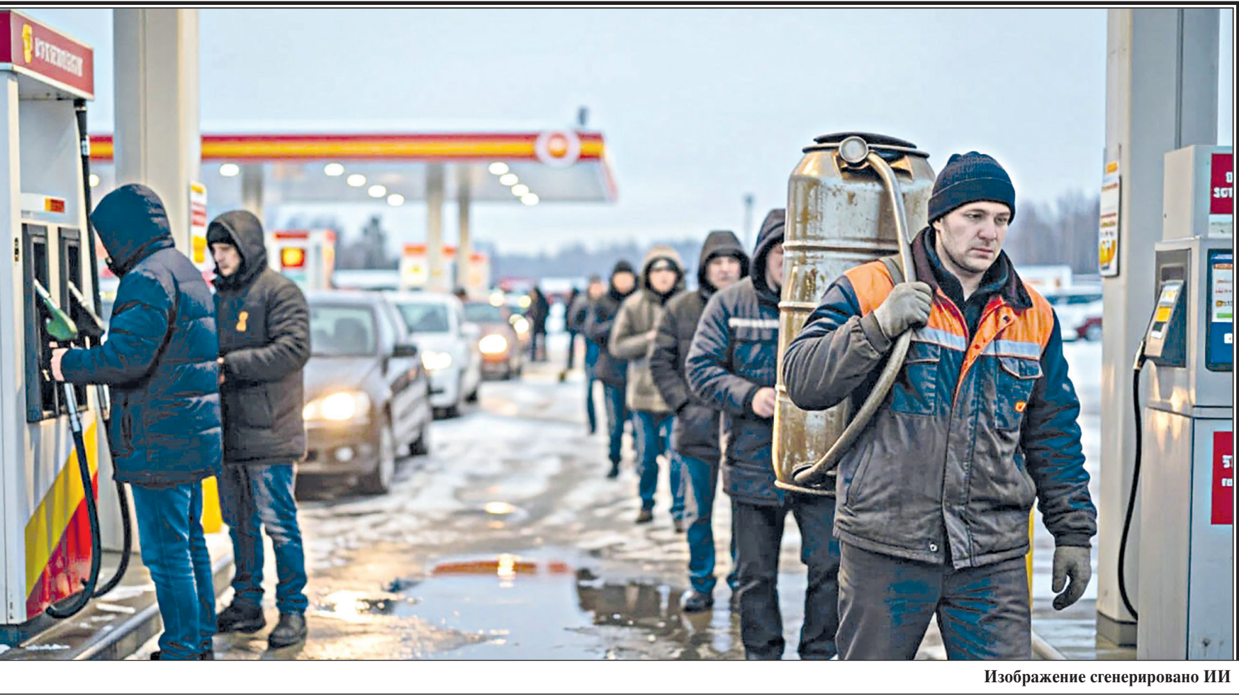
Изображение сгенерировано ИИ