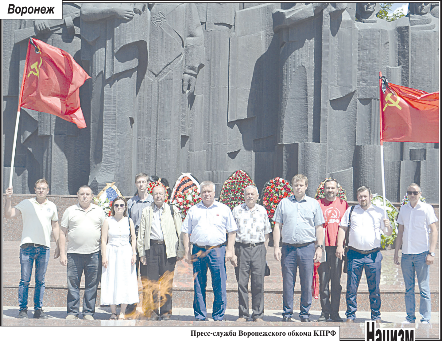
Пресс-служба Воронежского обкома КПРФ