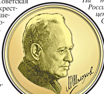
Шолоховская медаль.