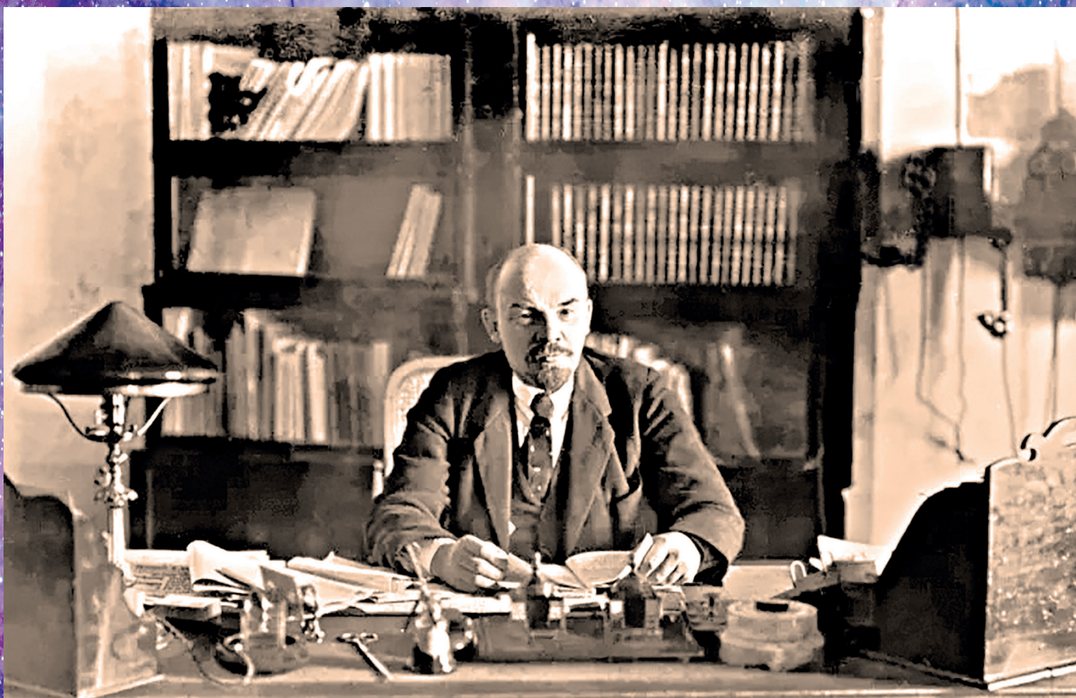
Первая фотография первого номера «Советской России» (1956 г.)