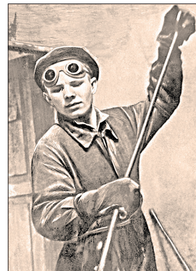
Юрий Гагарин — учащийся Люберецкого ремесленного училища во время практики.

Искренне поздравляю вас с замечательным юбилеем — 70-летием со дня основания газеты. Появление и деятельность вашей газеты вызывают у меня добрые воспоминания. Помню, как мы — молодые рабочие завода, да и жители города, с большим интересом