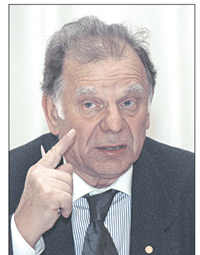
Жорес Алфёров, нобелевский лауреат.

Жорес Иванович АЛФЁРОВ (1930–2019) высоко ценил газету «Советская Россия», неоднократно высказывался о ней в положительном ключе и называл ее лучшей газетой страны. В одном из поздравлений к юбилею издания он заявил: «Советская Россия», с моей точки зрения, – лучшая газета страны – честная и независимая, воспитывает читателей настоящими патриотами нашей Родины».