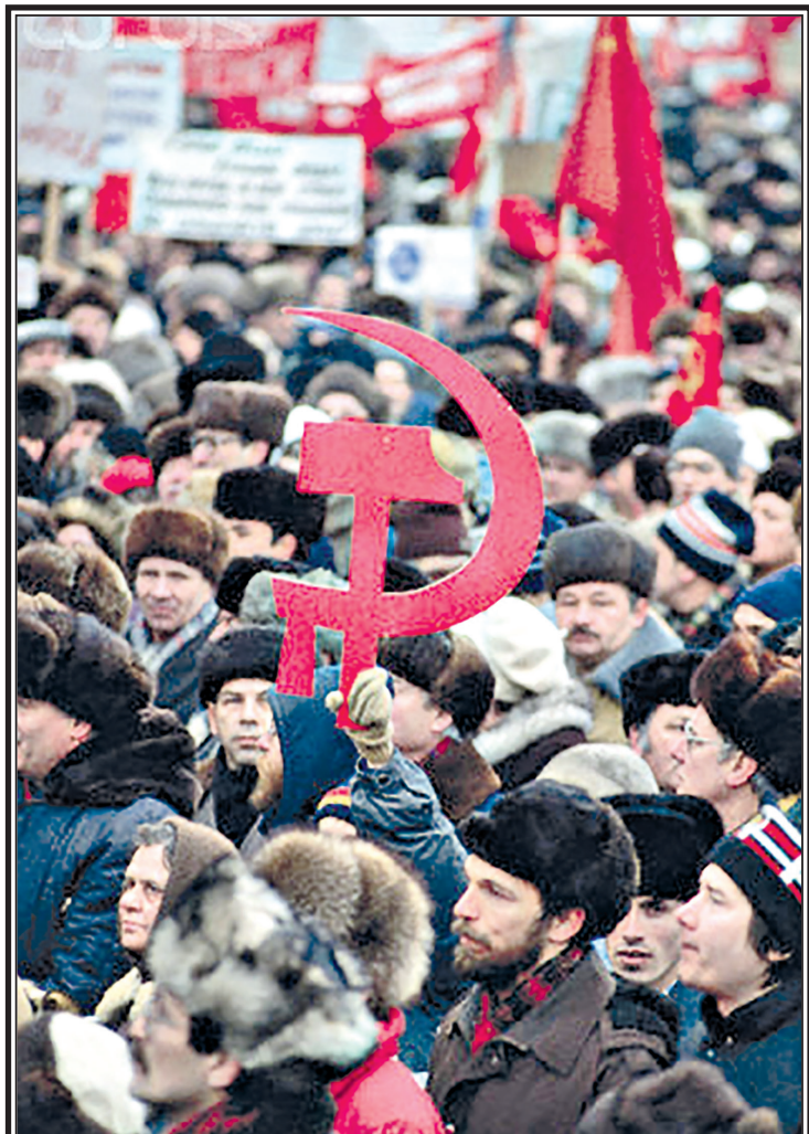
9 февраля 1992 года.

На мой взгляд, сейчас, после полученного нами – не только нашей страной, но и всем миром опыта, в том числе и опыта последних 36 лет без СССР, совершенно очевидно, что будущее не за рыночной стихией и не за производным от нее технототалитаризмом. Будущее за справедливым и организованным обществом. Как «Homo sapiens» сменил предыдущую версию человека, так и будущее будет за «че-