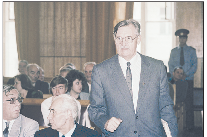
В. Варенников в зале суда.

Валентин Иванович ВАРЕННИКОВ (1923–2009) был одним из тех, кто поставил свою подпись под знаменитым «Словом к народу». Представ перед судом в ельцинской России, он принципиально отказался от амнистии. Свои показания перед судом Валентин Варенников начал с упоминания той судьбоносной публикации в «Советской России».