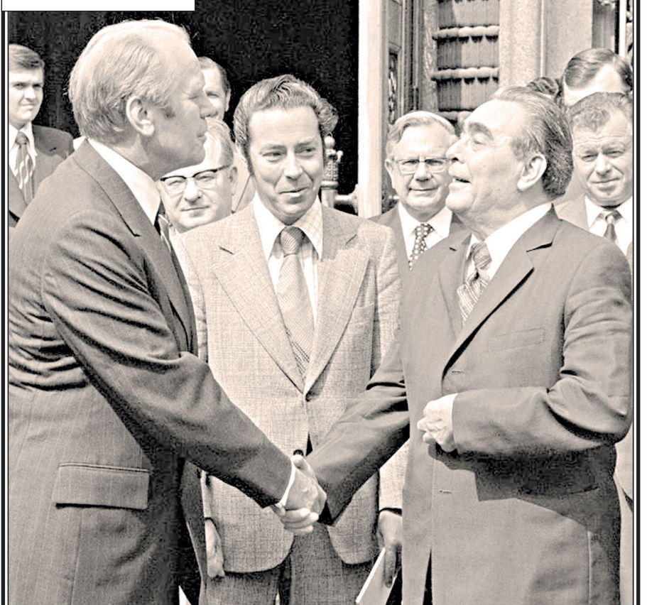
Генеральный секретарь ЦК КПСС Леонид Брежнев и президент США Джеральд Форд в Хельсинки (август 1975 г.)