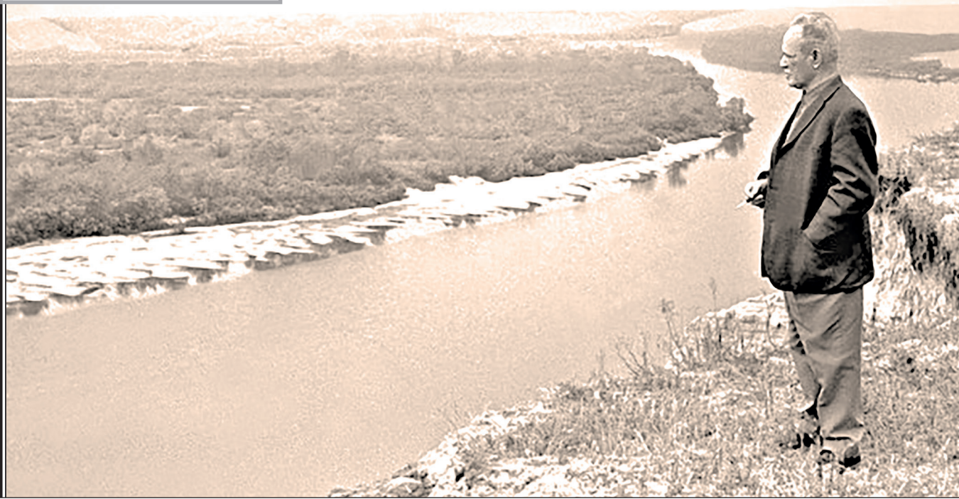
М.А. Шолохов (Дон).