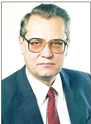
Посол по особым поручениям МИД СССР Ю.А. Квицинский.

В 2004–2006 годах Квицинский опубликовал в «Советской России» более 100 материалов. Как член редколлегии Квицинский не просто писал материалы для газеты, но и участвовал в формировании ее редакционной линии.