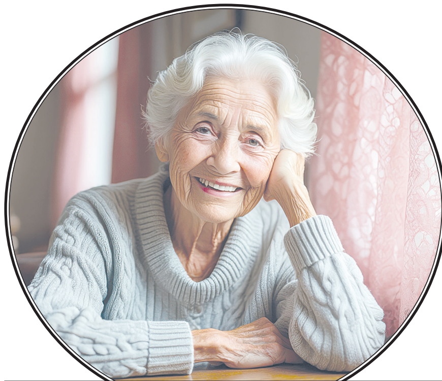
Так представляет себе наших верных читателей искусственный интеллект.

За народ и справедливость, Против пошлости, вранья, Она мужественно билась С темной тучей воронья.