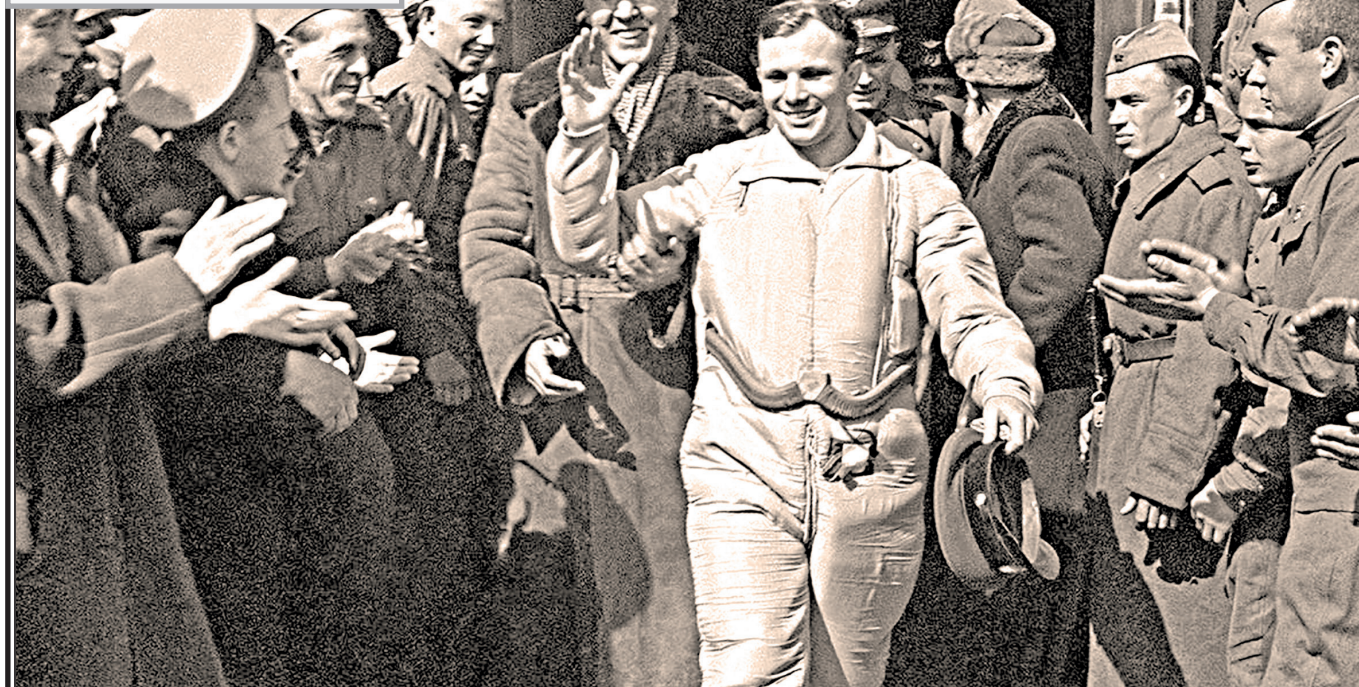
Ю.А. Гагарин вернулся из космоса.