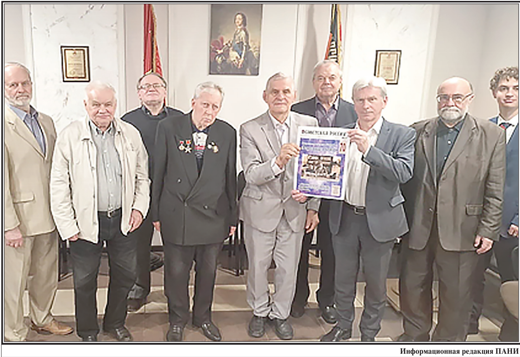
Информационная редакция ПАНИ